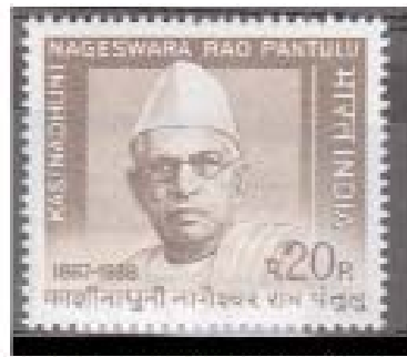
కాశీరాజుని సాగోత్రకాపురం వలసలు గాడు

స్వాతంత్ర్య సమరానికి అక్షరాయుధాలు అందించిన ఏకైక దినపత్రిక - స్థాపితం 1914