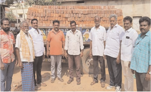
నూజివీడు,జనవరి,29 (ఆంధ్రపత్రిక) : రాష్ట్ర గృహనిర్మాణ, సమాచార శాఖ

మచిలీపట్నం జనవరి 29 (ఆంధ్రపత్రిక): ఐదేళ్ల పాలనలో పైసా పెట్టుబడి తీసుకురాకపోగా, ఉన్న పరిశ్రమల్ని తరిమికొట్టిన జగన్ రెడ్డి అండ్ కో పెట్టుబడుల గురించి, ముఖ్యమంత్రి దావోస్ వర్క్కుటన గురించి మాట్లాడడం హాస్యాస్పదమని రాష్ట్ర గవలు, భూగర్భ వనరులు, ఎక్సైజ్ శాఖ మంత్రి కొల్లు రవీంద్ర అన్నారు. విభజిత రాష్ట్రాన్ని పెట్టుబడులకు స్వర్గధామంగా మార్చే ప్రయత్నంలో భాగంగా నాడు చంద్రబాబు కాళ్ళకు చక్రాలు కట్టుకుని తిరిగి పెట్టుబడులు తీసుకొచ్చారన్నారు. విశాఖ కేంద్రంగా మూడు సార్లు పెట్టుబడిదారుల సదస్సులు నిర్వహించారన్నారు. అదానీ డేటా సెంటర్, లులూ, ఫ్రాంక్స్ రింపల్లర్స్ లాంటి ప్రఖ్యాత కంపెనీలను రాష్ట్రానికి రప్పించారన్నారు. వాటిని జగన్ రెడ్డి కుట్రపూరితంగా తరిమేయడం వాస్తవం కాదా? అని ప్రశ్నించారు. రాజకీయ కుట్రతో,రాష్ట్రానికి వేల కోట్ల ఆదాయం సమకూర్చే అమరరాజు బ్యాటరీస్ ను తరిమేస్తే తెలంగాణలో 9 వేల కోట్ల పెట్టుబడి పెట్టడం వాస్తవం కాదా అని నిలదీశారు. చంద్రబాబు కష్టంతో కియూ కార్ల పరిశ్రమ అనంతపురంలో ఏర్పాటు చేశారన్నారు. ఏపీఐబి డైరెక్ట్ గా, పర్యాటక శాఖ మంత్రిగా పని చేసిన రోజూ ఎప్పుడు ఎక్కడ ఎలా కమిషన్లు దండుకోవాలా? అని ఆలోచించారే తప్ప.. ఏ రోజైనా