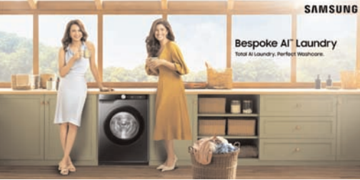
విజయవాడ,జనవరి 16 (ఆంధ్రపత్రిక): భారతదేశంలో అతిపెద్ద వినియోగదారు ఎలక్ట్రానిక్స్ బ్రాండ్ సామ్సంగ్, తమ

సరికొత్త 9 కేజీ ఫ్రంట్ లోడ్ వాషింగ్ మెషీన్లను విడుదల చేసినట్లు ప్రకటించింది. తెలిపిన, సమర్థవంతమైన లాండ్రీ సొల్యూషన్స్ కోర్త ప్రమాణాలను నిర్దేశించిన 12 కేజీ మోడల్స్ అద్భుతమైన విజయంతో, కొత్త 9 కేజీ వాషింగ్ మెషీన్ శ్రేణి అదే శక్తివంతమైన పనితీరు, అధునాతన లక్షణాలను మరింత కాంపాక్ట్ పరిమాణంలో అందిస్తుంది. తాజా 9 కేజీ ఫ్రంట్ లోడ్ వాషింగ్ మెషీన్స్ పెద్ద లోడ్లను నిర్వహించడానికి సరైన పరిమాణంలో ఉన్నాయి. ఇట్టలు, టెడ్ షీట్లు, తువ్వార్లు వంటి రోజువారీ లాండ్రీ సమర్థవంతమైన పరిష్కారాలను అందిస్తాయి.