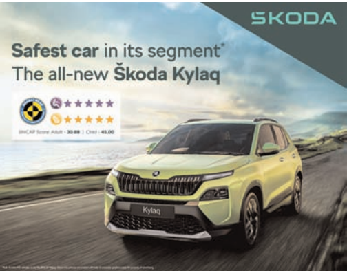
విజయవాడ,జనవరి 16 (ఆంధ్రపత్రిక): స్కోడా ఆలో ఇండియా మొదటి నోబీ-4 మీటర్ల ఎనియం కైలాక్, భారత్ ఎన్సీఎఫ్