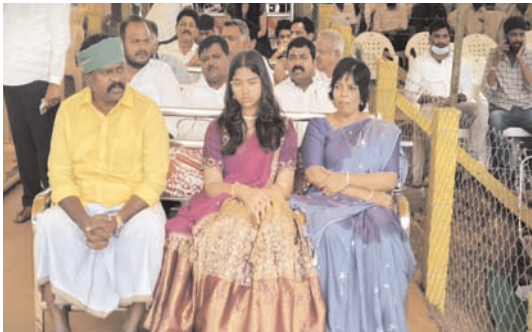
తిరువూరు జనవరి 15(ఆంధ్రపత్రిక): విస్సన్నపేట మండలం తాత కుంట్ల గ్రామంలో ఏర్పాటు చేసిన సంక్రాంతి సంబరాలలో తిరువూరు ఎమ్మెల్యే కాలిక పూడి శ్రీనివాసరావు కుటుంబ సభ్యులతో