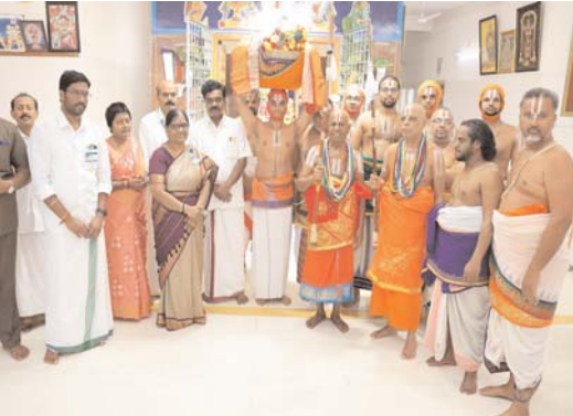
తిరుమల, జనవరి 15, (ఆంధ్రపత్రిక) : శ్రీవారికి మహా భక్తురాలైన (ఆండాళ్ అమ్మవారు) శ్రీ గోదాదేవి పరిణయోత్సవం