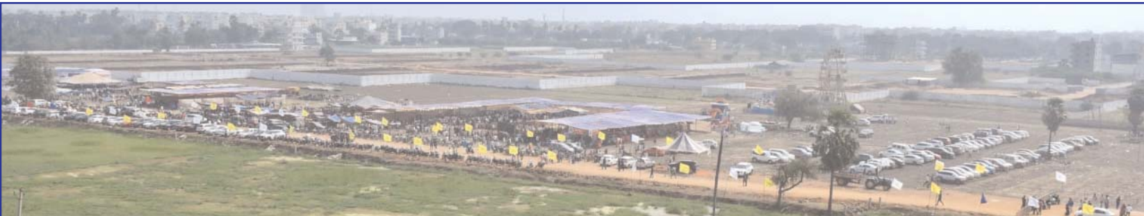
బుధవారం కనుమ పండుగ సందర్భంగా విజయవాడ సమీపంలో కొడిపందాలు