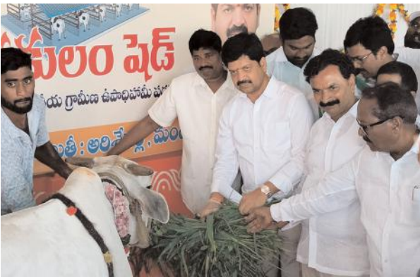
సంచాలకులు, నగర వార్డు పశుసంపర్లక శాఖ సిబ్బంది, ఆరిసేపల్లి