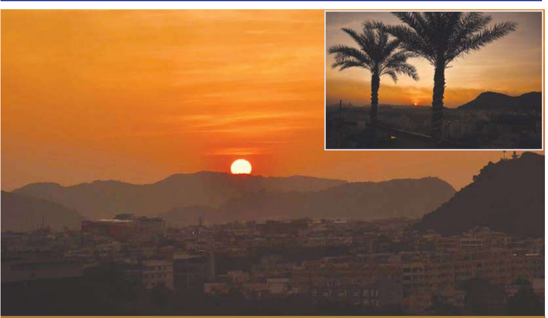
2024 సంవత్సరం ముగింపు సందర్భంగా విజయవాడ స్ట్రైప్స్ సూర్యాస్తమయ దృశ్యం