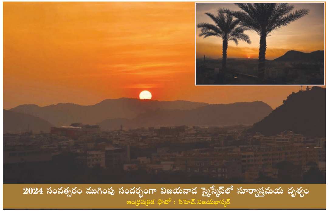
2024 సంవత్సరం ముగింపు సందర్భంగా విజయవాడ సైన్స్ కలెజ్ సూర్యాస్తమయ దృశ్యం