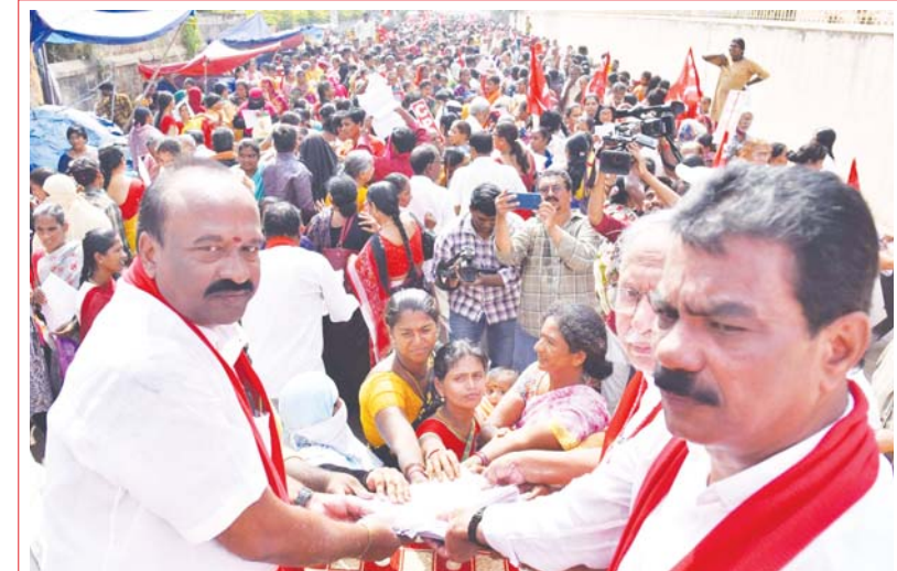
విజయవాడలో పేదల నుంచి ఇంటి స్థలాల దరఖాస్తులను సేకరించిన సీపీఐ నాయకులు..

అమరావతి, నవంబర్ 27 (ఆంధ్రపత్రిక): ఎర్రచందనం అమ్మకాలు, ఎగుమతుల ప్రక్రియను సింగిల్ విండో విధానానికి మార్చాలని, దీని ద్వారా అంతర్జాతీయ స్థాయిలో నిర్వహించే ‘ఈ-వేలం’లో మెరుగైన ఫలితాలు వస్తాయని ఉప ముఖ్యమంత్రి పవన్ కల్యాణ్ కేంద్ర అటవీ, పర్యావరణ శాఖ మంత్రి భూపేంద్ర యాదవ్ కు తెలియ చేశారు. దేశ రాజధాని ఢిల్లీలో పర్యటి స్తున్న పవన్ కల్యాణ్ బుధవారం ఉదయం భూపేంద్ర యాదవ్ కు సమావేశమయ్యారు. ఈ సందర్భంగా ఎర్రచందనం రక్షణ, స్వగ్రాంట్ నిరోధం, దుంగల అమ్మకం విషయంలో అనుసరి స్తున్న విధానాల మీద కేంద్ర మంత్రితో చర్చించారు.