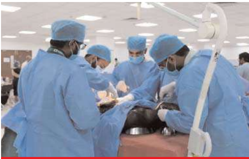
కిడ్నీ మార్పిడి చికిత్స చేస్తున్న వైద్య నిపుణుల బృందం