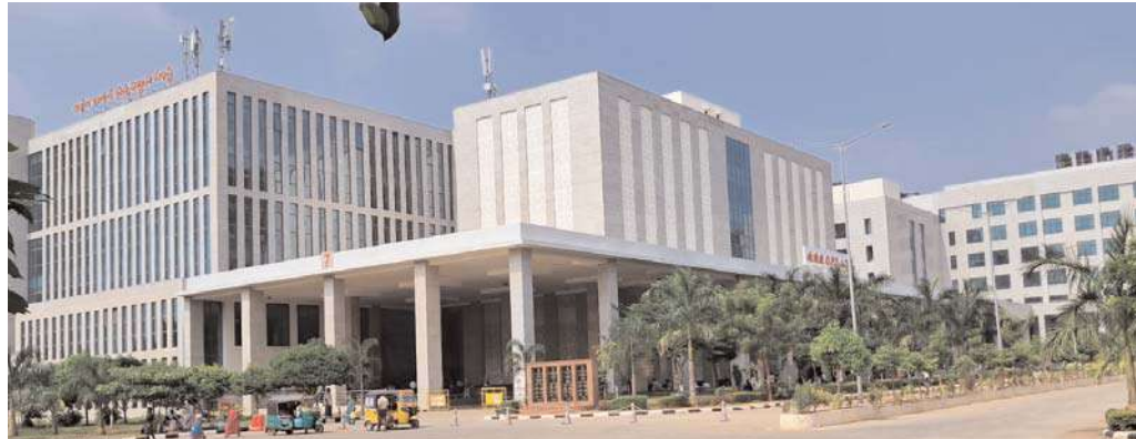
ప్రకృతి అందాలనడుమ మంగళగిరి ఎయిమ్స్