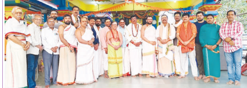
శ్రీశైల మల్లన్న దర్శనానికి వయసం