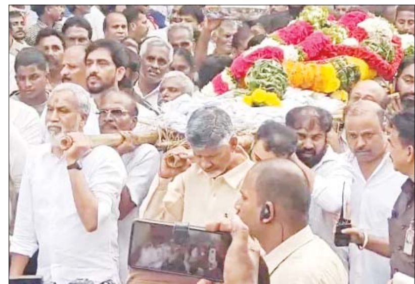
తమ్ముడి పాద మోసిన ముఖ్యమంత్రి నారా చంద్రబాబు నాయుడు

నెల్లూరు,నవంబరు 17 (ఆంధ్రపత్రిక):నెల్లూరు నగరపాలక సంస్థ కార్యాలయంలో వివిధ విభాగాల అధికారులతో మంత్రి నారాయణ సమీక్ష నిర్వహించారు. భవన నిర్మాణ అనుమతులకు సంబంధించి కొత్త విధానాన్ని త్వరలోనే తీసుకువస్తున్నామని మంత్రి వెల్లడించారు. డిసెంబర్ 15 నాటికి ఈ విధానం అమలులోకి తెస్తేనేందుకు కృషి చేస్తున్నామన్నారు. దీనికి సంబంధించి త్వరలోనే అసెంబ్లీలో బిల్లు పెడతామని చెప్పారు. 20 రాష్ట్రాల్లో అధ్యయనం చేసిన తర్వాతనే కొత్త విధానాలను రూపొందించా మన్నారు. నగరపాలక సంస్థలు మునిసిపాలిటీలు చేసే పంచాయతీల అభివృద్ధి కోసం ప్రజలు తాము చెల్లించాల్సిన పన్నులను సత్వరమే కట్టాలని కోరారు. ఇందుకోసం రాష్ట్ర వ్యాప్తంగా సైబల్ డ్రైవ్ ను కూడా నిర్వహిస్తున్నారని, అభివృద్ధికి ప్రజలు కూడా తమ వంతు సహకారం అందించాలన్నారు. వాణిజ్య సంస్థలు భారీగా బకాయిలను చెల్లించాల్సి ఉందన్నారు. మునిసిపల్ శాఖ మంత్రిగా సైబల్ విజ్ఞప్తి చేస్తున్నారన్నారు. అందరూ సహకరించి పన్నులను చెల్లించాలని మంత్రి నారాయణ విజ్ఞప్తి చేశారు.