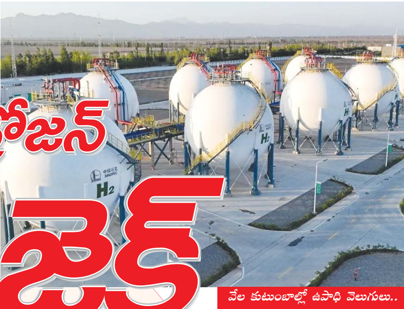
వేల కుటుంబాల్లో ఉపాధి వెలుగులు..

ఈ ప్రాజెక్టు ద్వారా ప్రత్యక్షంగా, పరోక్షంగా 25 వేల మందికి ఉపాధి దొరకనుంది. 2032 నాటికి ఈ ప్లాంట్ నుంచి 60 గిగావాట్ల విద్యుత్తు ఉత్పత్తి చేయాలని లక్ష్యంగా నిర్దేశించుకున్నారు. ప్రాజెక్టు నుంచి ఉత్పత్తయ్యే విద్యుత్తులో సింహభాగం ఏపీ అవసరాలకు వినియోగించుకోవాలనే ఉద్దేశంతో సీఎం చంద్రబాబు ఇందులో 50% వాటాను ఏపీ జెనెకోతో పెట్టించాలని నిర్ణయం తీసుకున్నారు.