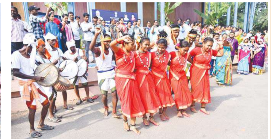
గిరిజన స్వాధీమాన్ ఉత్సవాలు-2024లో భాగంగా విజయవాడలో సంబరాలు చేస్తున్న గిరిజనులు...