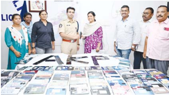
శం., విజయనగరం, విశాఖపట్నం, తూర్పు, పశ్చిమ గోదావరి, కృష్ణా, కడప, తెలంగాణ మరియు తమిళనాడు రాష్ట్రాల నుండి రికవరీ చేసిన 200 మొబైల్ ఫోన్లను. సుమారు 30 లక్షల

అనకాపల్లి, నవంబర్ 13 (ఆంధ్రపత్రిక): కేంద్ర ప్రభుత్వం ప్రవేశపెట్టిన మొబైల్ మిస్సింగ్ కోల్డ్ మి యొక్క పోయిన మొబైల్ ఫోన్ వివరాలు అందించవచ్చు అన్నారు. ఆపై వెంటనే ఐటీ కోర్ట్ బృందం క్రిస్టి చేస్తూ బాధితులకు మొబైల్స్ అందజేసేందుకు కృషి చేస్తుందన్నారు. అలాగే మొబైల్ ఫోన్ పోతే జిల్లా పోలీసు వాట్సాప్ నెంబర్: 93469 12007కు హాట్ అని టైప్ చేయడం ద్వారా పోయిన మొబైల్స్ ఫిర్యాదుల స్వీకరణకు ఎఫ్.ఐ.ఆర్ కట్టకుండా, పోలీసు స్టేషన్ కు వెళ్లకుండా సులభతరం చేసిన జిల్లా పోలీసులు, మొబైల్ వివరాలను తెలియజేస్తే బాధితులకు త్వరితగతిన అందజేసేందుకు కృషి చేస్తున్నారు. అనకాపల్లి జిల్లా పోలీసులు అతి తక్కువ సమయంలోనే 8వ విడతలో భాగంగా వివిధ ఉమ్మడి జిల్లాలు అయిన శ్రీకాకు