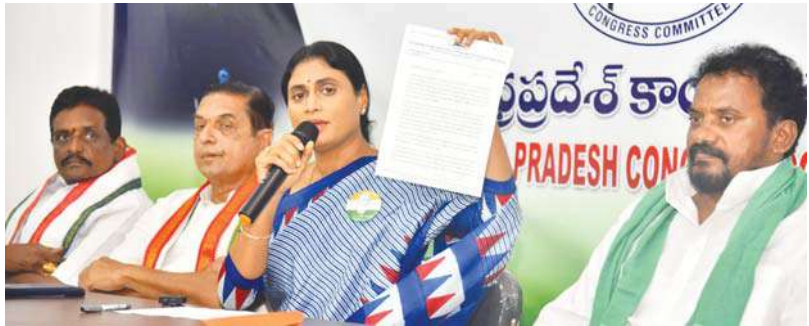
విలేకరుల సమావేశంలో మాట్లాడుతున్న ఏపీసీసీ అధ్యక్షురాలు వైఎస్ షర్మిలారెడ్డి.