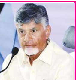
యురేనియం తవ్వకాలపై ముఖ్యమంత్రి చంద్రబాబు నిర్ణయం

అమరావతి, నవంబరు 12 (ఆంధ్రపత్రిక): కర్నూలు జిల్లాలో యురేనియం తవ్వకాలపై రాష్ట్ర ప్రభుత్వం కీలక నిర్ణయం తీసుకుంది. యురేనియం తవ్వకాలు ఆపేయాలని ముఖ్యమంత్రి చంద్రబాబు ఆదేశించారు. ప్రజల ఆందోళనల దృష్ట్యా తవ్వకాలు నిలిపివేయాలని సీఎం ఆదేశించారు.