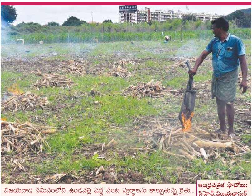
విజయవాడ సమీపంలోని ఉండవల్లి వద్ద పంట వృద్ధులను కాల్చుతున్న రైతు..