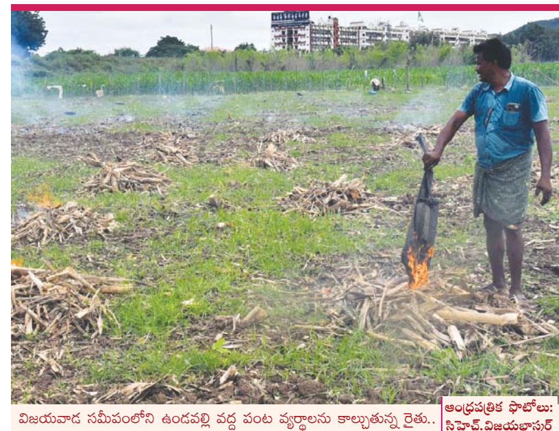
విజయవాడ సమీపంలోని ఉండవల్లి వద్ద పంట వ్యర్థాలను కాల్చుతున్న రైతు..