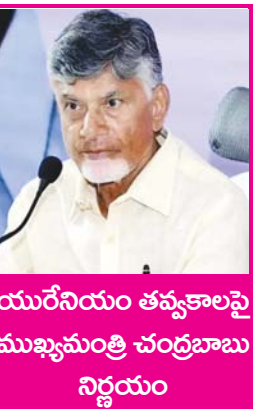
యురేనియం తవ్వకాలపై ముఖ్యమంత్రి చంద్రబాబు నిర్ణయం

అమరావతి, నవంబరు 12 (ఆంధ్రప్రదేశ్): కర్నూలు జిల్లాలో యురేనియం తవ్వకాలపై రాష్ట్ర ప్రభుత్వం కీలక నిర్ణయం తీసుకుంది. యురేనియం తవ్వకాలు ఆపేయాలని ముఖ్యమంత్రి చంద్రబాబు ఆదేశించారు. ప్రజల ఆందోళనల దృష్ట్యా తవ్వకాలు నిలిపివేయాలని సీఎం ఆదేశించారు.