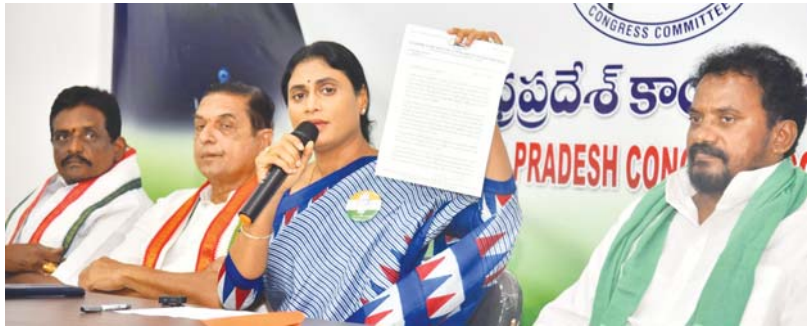
విలేకరుల సమావేశంలో మాట్లాడుతున్న ఏపీసీసీ అధ్యక్షురాలు వైఎస్ షర్మిలారెడ్డి.