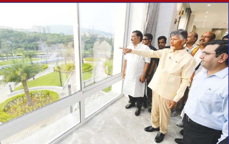
రుక్మిణింద్రపై నిర్మించిన భవనాలను మంత్రులు, ఎమ్మెల్యేలతో కలిసి పరిశీలించిన సీఎం చంద్రబాబు