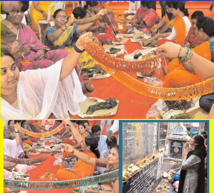
శనివారం విజయవాడలోని బుద్ధగిరిలోని ఉన్న కనకదుర్గ ఆలయంలో కార్తీక మాసం సందర్భంగా "గాజుల మహోత్సవం" సందర్భంగా కలకత్తా హోస్టల్ నిర్మించే పనులకు దృశ్యం