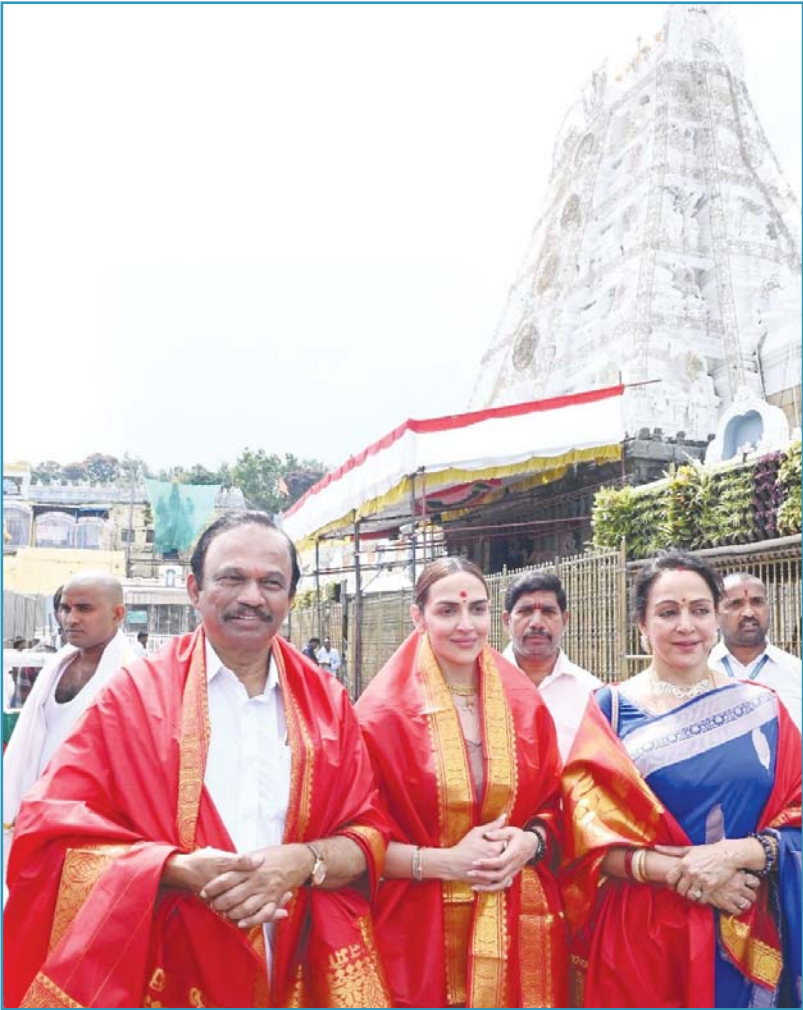
తిరుమలలోని అఖిలాంధకోటి బ్రహ్మాండ నాయకుడు కలియుగ దైవం శ్రీ వెంకటేశ్వర స్వామి వారిని దర్శించుకొన్న ఒంగోలు పార్లమెంట్ సభ్యులు మాగుంట శ్రీనివాసులు రెడ్డి, ఉత్తర ప్రదేశ్ రాష్ట్రంలోని మధుర నియోజకవర్గ బీజేపీ పార్లమెంట్ సభ్యులు మరియు ప్రముఖ హిరోయిన్ హేమామాలిని వారి కూతురు ప్రముఖ బాలీవుడ్ హిరోయిన్ ఈషా దియోల్.

గుంతలు లేని రోడ్లు ఉండాలన్నారు. వర్షం వస్తే గతంలో రోడ్లు స్క్విమ్మింగ్ పూలేను తలపించే విధంగా ఉన్నాయన్నారు. రాడీ రాజకీయాలు వద్దని.. అభివృద్ధి రాజకీయాలు కావాలని వెల్లడించారు. “నేను ఎక్కడకు వెళ్ళినా పరదాలు లేవు, చెట్లు కొట్టడం లేదు. మళ్ళీ రాష్ట్రానికి మంచి రోజులు వచ్చాయి. మంచి రోడ్లు వస్తాయి” అని తెలిపారు. ప్రభుత్వ కార్యాలయాలను, మద్యాన్ని తాకట్టు పెట్టి దబ్బాలు తెచ్చారని వ్యాఖ్యలు చేశారు. రాష్ట్రాన్ని పునర్నిర్మాణం చేయాలన్నారు. దబ్బాలు ఊరికనే రావు... సంపద సృష్టి దబ్బాలు వస్తాయన్నారు. రూ. 860 కోట్లు తో రాష్ట్రంలో మొత్తం గుంతలు పూడుస్తున్నామన్నారు. రాష్ట్రంలో జగన్ విధ్వంసం సృష్టించారన్నారు. గాడి తప్పిన వ్యవస్థలను... గాడిలో పెడతానని తెలిపారు. రానున్న రోజుల్లో అన్ని రోడ్లు వేస్తామని ఇందుకోసం ఒక పక్కా ప్రణాళిక వేస్తున్నామని ముఖ్యమంత్రి చంద్రబాబు నాయుడు పేర్కొన్నారు.