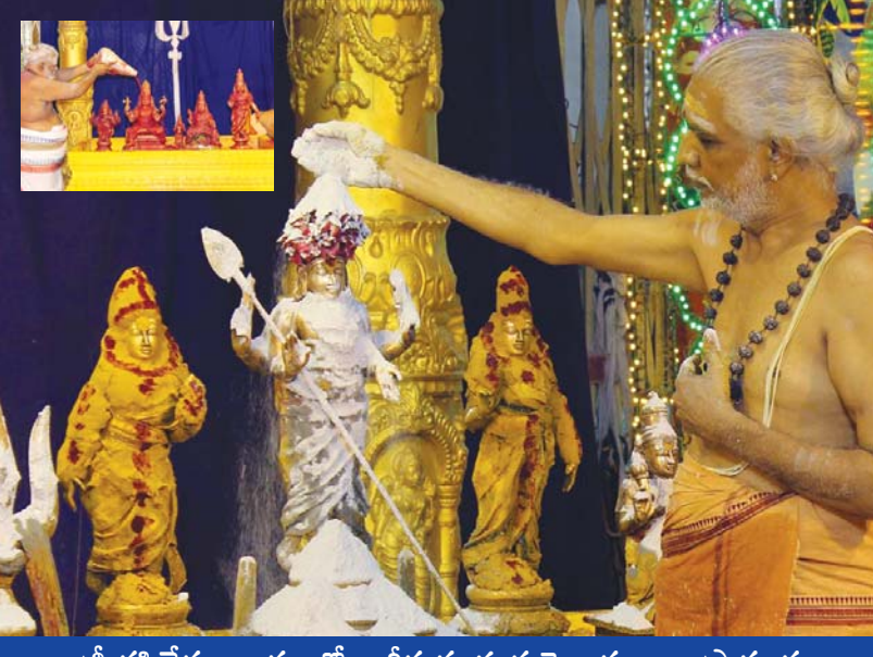
శ్రీ కపిలేశ్వరాలయంలో కార్తీక మాస మహోత్సవాలు ప్రారంభం