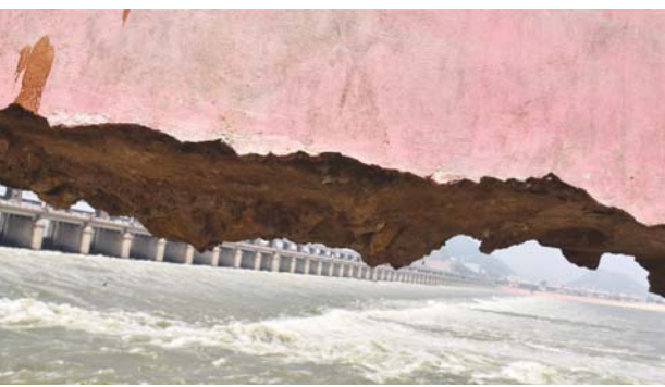
విజయవాడలోని సీతానగరం వద్ద డెబ్బతిన్న ప్రకాశం బ్యారేజీలో కొంత భాగం...