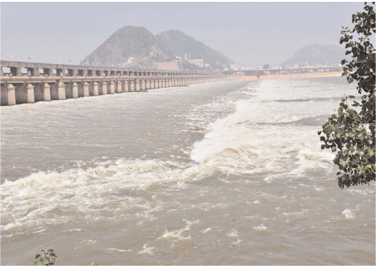
ప్రకాశం బ్యారేజీ నుంచి మిగులు జలాలను విడుదల చేసిన ఇరిగేషన్ అధికారులు