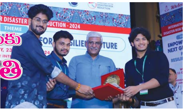
మొత్తం 74 ఎంట్రీలను పరిశీలించిన న్యాయ నిపుణులు ఏపీ ఎస్ఆర్ఎం వర్చువల్ విద్యార్థులు నిర్మించిన 'అఫ్టర్ షాక్' అనే ఫార్ట్ ఫిల్మ్కు ద్వితీయ బహుమతిని ప్రకటించారు. భూకంపాల సమయంలో ఇద్దరు వ్యక్తులు ఎదుర్కొన్న ఇక్కడను చక్కగా వివరించడమే కాకుండా ప్రతికూల పరిస్థితుల్లో తీసుకోవాల్సిన జాగ్రత్తలను వివరించడంలో విద్యార్థులు సఫలీకృతులయ్యారు. న్యూఢిల్లీలోని డాక్టర్ బీఆర్ అంబేద్కర్ ఇంటర్నేషనల్ సెంటర్లో ఈ నెల 23న జరిగిన కార్యక్రమంలో కేంద్ర సాంస్కృతిక శాఖ మంత్రి గజేంద్ర సింగ్ షెకావత్ చేతుల మీదుగా జ్ఞాపికతో పాటు ప్రశంసా పత్రాలను. రూ.1.50 లక్షల నగదు బహుమతిని అందుకున్నారు.