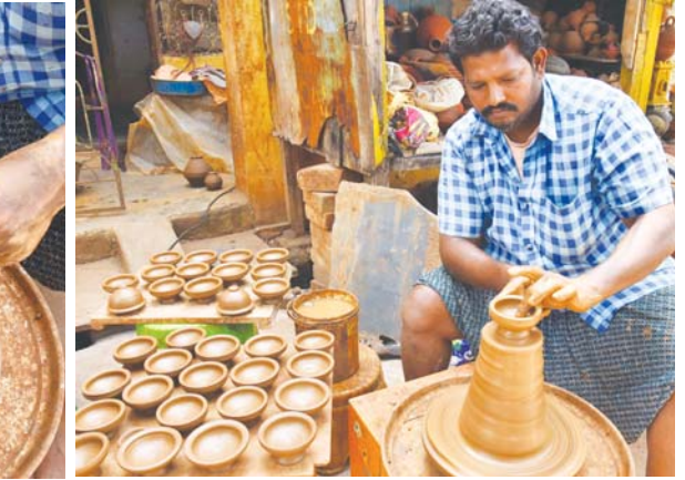
రాజ్ యే దీపావళి కోసం మట్టి దీపాలను తయారు చేస్తున్న కార్మికుడు..