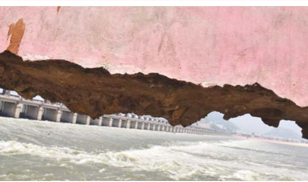
విజయవాడలోని సీతానగరం వద్ద డెబ్బతిన్న ప్రకాశం బ్యారేజీలో కొంత భాగం...