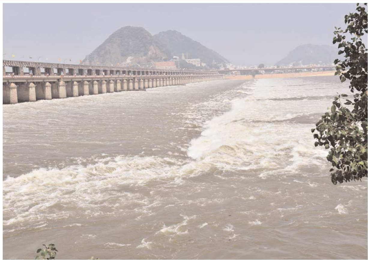
ప్రకాశం బ్యారేజీ నుంచి మిగులు జలాలను విడుదల చేసిన ఇరిగేషన్ అధికారులు