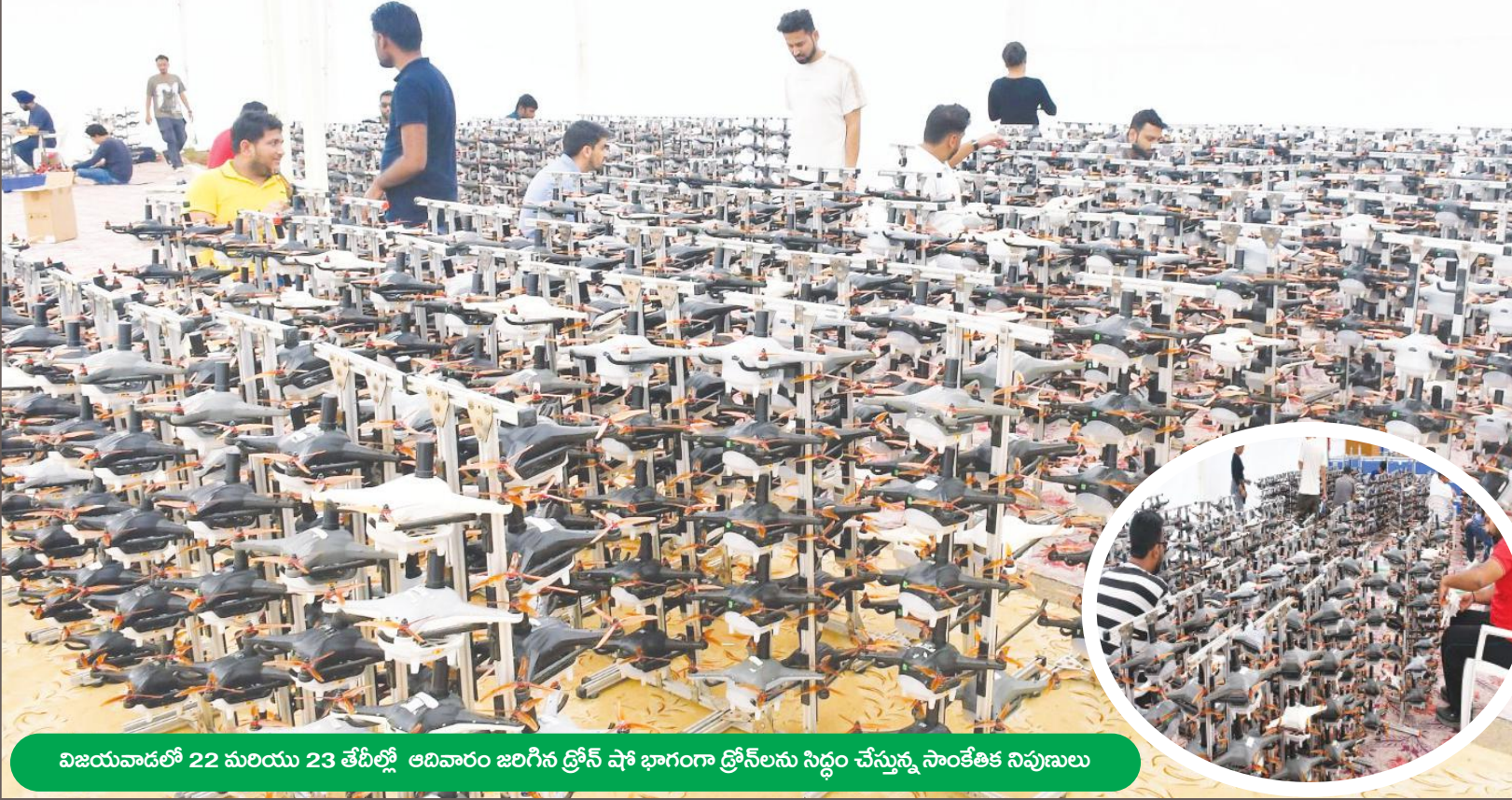
విజయవాడలో 22 మరియు 23 తేదీల్లో అదివారం జరిగిన ట్రోఫీ షో భాగంగా ట్రోఫీలను సిద్ధం చేస్తున్న సాంకేతిక నిపుణులు