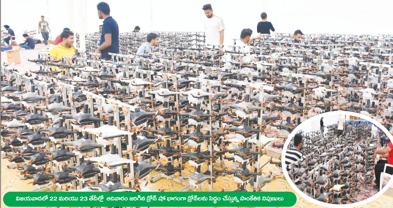
విజయవాడలో 22 మరియు 23 తేదీల్లో ఆదివారం జరిగిన ట్రోఫీ షో భాగంగా ట్రోఫీలను సిద్ధం చేస్తున్న సాంకేతిక నిపుణులు

BNKU 1వ అంతర్జాతీయ FIDE చెస్ ఫెస్టివల్-2024 నిర్వాహకులు ఆదివారం విజయవాడలో విలేజ్ కరల్ సమావేశంలో ట్రోఫీలను ప్రదర్శిస్తున్నారు. ఈ మ్యూచ్ అక్టోబర్ 22 నుండి 27 వరకు ICON పబ్లిక్ స్కూల్లో జరుగుతుంది.