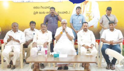
రాష్ట్ర సమగ్ర అభివృద్ధికి సరికొత్త నిర్ణయాలు తీసుకుంటున్న సీఎం : మంత్రి

చురుగ్గా సభ్యత్వ సమోదాయం: ప్రతి ఒక్క కార్యకర్త కూడా పార్టీ సభ్యత్వం సమోదాయ కార్యక్రమంలో చురుగ్గా పాల్గొని, పార్టీ బలోపేతానికి తమ వంతు కృషి చేయాలని పిలుపునిచ్చారు. రెండేళ్ల పార్టీ సభ్యత్వానికి 100 రూపాయలు ఆవైసలో చెల్లించాలని, సభ్యత్వం పొందిన ప్రతి ఒక్క కార్యకర్త సంక్షేమానికి పార్టీ భరోసాగా ఉంటుందని మంత్రి స్పష్టం చేశారు. సభ్యత్వం పొందిన ప్రతి కార్యకర్తకు ఐదు లక్షల వరకు టీమా సౌకర్యాల కల్పిస్తున్నట్లు చెప్పారు. అన్ని మండలాల్లో ప్రత్యేక డ్రైవ్ నిర్వహించి సభ్యత్వాన్ని పూర్తి చేస్తామని మంత్రి చెప్పారు.