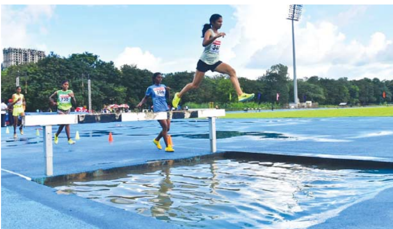
గుంటూరు జిల్లా ఆచార్య నాగార్జున యూనివర్సిటీలో సౌత్ జోన్ స్ట్రీట్ చేజ్లో జరిగిన అథ్లెట్స్ పోటీలు.

తిరుమల, అక్టోబరు 18 (ఆంధ్రపత్రిక): కలియుగ ప్రత్యక్ష దైవంగా కొలిచే తిరుమల శ్రీ వేంకటేశ్వరుడి దర్శనభాగ్యం కోసం ప్రపంచ నలుమూలల నుంచి భారీగా భక్తులు తరలివస్తుంటారు. నిత్యం లక్షల సంఖ్యలో భక్తులు శ్రీవారిని దర్శించుకుంటున్నారు. ఈ క్రమంలో స్వామివారి దర్శనమే కాకుండా ఆయనకు సేవ చేసే భాగ్యాన్ని కూడా ఢిల్లీ కల్పించింది. ఈ మేరకు భక్తుల సౌకర్యార్థం కోసం 2025 జనవరికి సంబంధించిన శ్రీవారి ఆర్జిత సేవలు, దర్శన టికెట్లు కోటాను ఈ నెలలో ఢిల్లీ అందుబాటులోకి తీసుంది. తిరుమల శ్రీవారి ఆర్జిత సేవా టికెట్లకు సంబంధించి 2025 జనవరి కోటాను అక్టోబర్ 19న ఉదయం 10 గంటలకు తిరుమల తిరుపతి దేవస్థానం (టీటీడి) ఆన్‌లైన్‌లో విడుదల చేయనుంది. ఈ సేవా టికెట్ల ఎలక్ట్రానిక్ డివ్ కోసం అక్టోబరు 21వ తేదీ ఉదయం 10 గంటల వరకు ఆన్‌లైన్‌లో సమాధి చేసుకోవచ్చని ఢిల్లీ ప్రకటించింది. ఈ టికెట్లు పొందిన భక్తులు అక్టోబర్ 21 నుంచి 23వ తేదీ మధ్యాహ్నం 12 గంటల లోపు సాము చెల్లించాల్సి ఉంటుంది. వారికి లక్ష్మీదేవ్ టికెట్లు మంజూరవుతాయి. కాగా కళ్యాణోత్సవం, ఊరిజల్ సేవ, ఆర్జిత బ్రహ్మోత్సవం, సహస్ర దీపాలంకార సేవా టికెట్లను అక్టోబర్ 22న ఉదయం 10 గంటలకు విడుదల చేస్తారు.