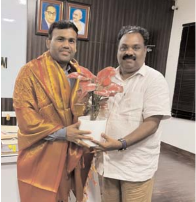
ఆర్టివోని మర్యాదపూర్వకంగా కలిసిన

వచ్చిన వైసీపీ 11కి పడిపోయిందో ప్రతీ ఒక్కరూ గ్రహించాలని అన్నారు. ‘మనమూ అదే తీరున వచ్చే రాష్ట్రం మళ్లీ రావణ కాష్టమే.. తప్పు చేసిన వారిని వదిలి పెట్టకూడదు, అలాగని కక్షసాధింపులకు వెళ్లకూడదు... ఈ వ్యత్యాసాన్ని గమనించాలి. సంఘటిత శక్తిగా పని చేస్తేనే ప్రజల అంచనాలను అందుకోగలం. ఎన్నిపిల్లో ఎవ్వరు తప్పు చేసినా ఆ ప్రభావం ముఖ్యమంత్రి మీదే ఉంటుందని ప్రతీ ఒక్కరూ గుర్తుపెట్టుకోవాలి. నాయకుడికి విశ్వస నీయత రావాలంటే ఎంతో సమయం పట్టినా... చెదకొట్టుకోవా లనుకుంటే నిమిషం చాలు. నాతో సహా ఎవరికైనా ఇదే ఫార్ములా వర్తిస్తుంది. తదుపరి ఎన్ని కలకు నిద్రమపుతున్నామనే సంతేతం ఇచ్చేందుకే నిన్ను ప్రధాని ఎన్నెది ముఖ్యమంత్రిల సమావేశంలో ఐదు గంటలు కూర్చున్నారు. ఇక్కడ మనమూ అదే సిద్ధాంతాన్ని అనుసరించాలి’ అని స్పష్టం చేశారు.గత ఐదేళ్లు సాగిన అరాచకం కారణంగా నాతో సహా, ప్రజలు, నేతలు అంతా ఇబ్బంది పడ్డారు. గెలిచాం కాబట్టి ఇక మన పని అపోయిందనుకుంటే చాలా ఇబ్బందులు ఉంటాయని గుర్తించాలి. యువత, విద్యావంతులను ఇలా దాదాపు 65 మంది కొత్త ఎమ్మె ల్యేలు పడ్డారు. మంత్రిల్లో 18 మంది కొత్తవారే ఉన్నారు. ప్రతీ ఇంట్లోనూ చిన్నపాటి సమస్యలుండి సమన్వయం చేసుకున్నట్లే... కుటుంబం లాంటి పార్టీలోనూ ఉండటం సహజం’ అని చంద్రబాబు వెల్లడించారు. ఇసుక, మద్యం విధానాల్లో వైసీపీ చేసిన తప్పు పార్టీ నాయకులూ చేస్తానంటే ఊరుకోనని హెచ్చరించారు. ప్రజలు మన ల్ని అనుమానించే పరిస్థితి వస్తే నేతలకూ ఇబ్బంది అని అన్నారు.