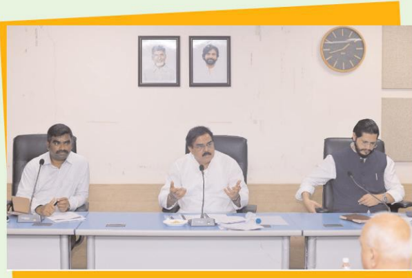
విజయవాడ, అక్టోబర్ 18 (ఆంధ్రప్రదేశ్): రాష్ట్ర ముఖ్యమంత్రి నారా