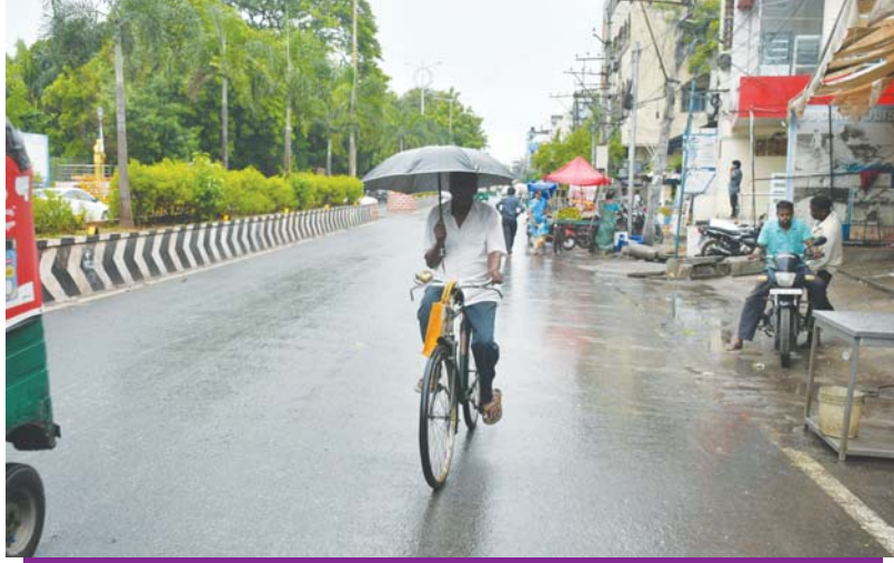
బుధవారం మేఘాలు కమ్ముకున్న విజయవాడలోని బిఆర్‌డిఎస్ రోడ్డు