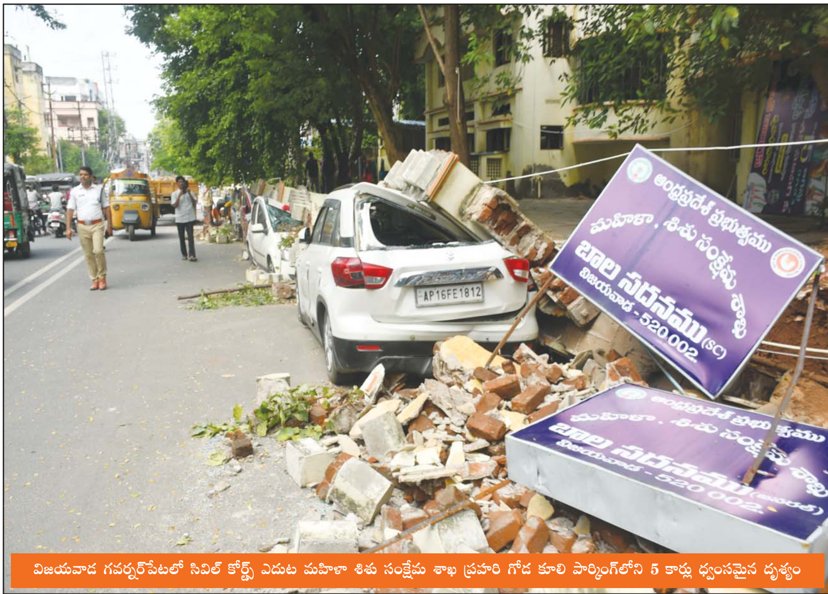
విజయవాడ గవర్నర్‌పేటలో సివిల్ కోర్ట్ ఎదుట మహిళా శిశు సంక్షేమ శాఖ ప్రహరీ గోడ కూలి పార్కింగ్‌లోని 5 కార్లు ధ్వంసమైన దృశ్యం