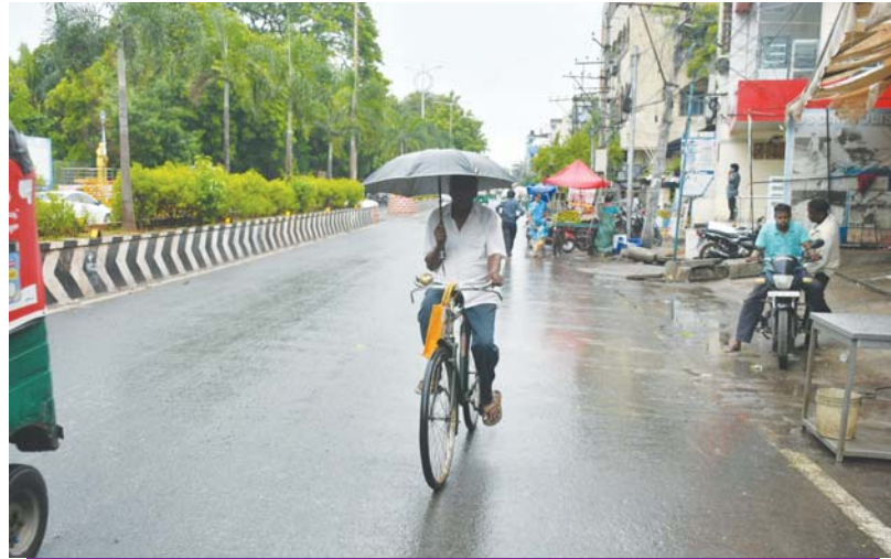
బుధవారం మేఘాలు కమ్ముకున్న విజయవాడలోని బిఆర్‌డిఎస్ రోడ్డు