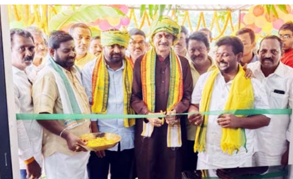
కె.కోటపాడు, అక్టోబరు 13 (ఆంధ్రపత్రిక): పర్యావరణ సమతుల్యాన్ని కాపాడుకునేందుకు కాలావ్వ రహిత వాహనాలను వినియోగించాల్సిన అవసరం