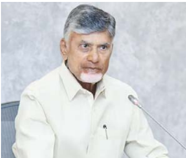
అమరావతి, అక్టోబరు 6 (ఆంధ్రపత్రిక) : ఏపీ ముఖ్యమంత్రి చంద్రబాబు దిల్లీలో రెండు రోజులపాటు