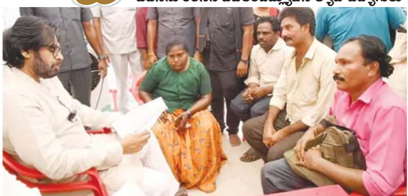
అమరావతి, అక్టోబరు 6 (ఆంధ్రపత్రిక) : ఉద్యోగ భద్రత కల్పించాలని కోరుతూ పలువురు ఉద్యోగులు ఉపముఖ్యమంత్రి పవన్ కల్యాణ్ ను కలిసి

- పవన్ కుమార్ పటేల్ బిల్లును ల్యాబ్ ఉద్యోగులు