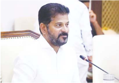
హైదరాబాద్, అక్టోబరు 6 (ఆంధ్రపత్రిక) : గత ప్రభుత్వం ఉద్యోగాల భర్తీని నంపర్ వాలర్ కాడ్డ్ సాగదీసిందని, నోటిఫికేషన్ల దశలోనే కొన్నేళ్ల పాటు ఉంచారని ముఖ్యమంత్రి