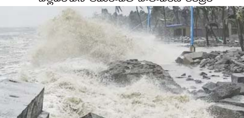
అమరావతి, అక్టోబరు 6 (ఆంధ్రపత్రిక) : అక్టోబర్ మాసం వర్షింగ్ లో వర్షాలు తగ్గుముఖం పట్టాలి. అయితే ప్రస్తుతం తెలు గు రాష్ట్రంలో ఆ పరిస్థితులు కొనసాగడం లేదు. విపరీతమైన ఎండ ఉత్పాదకతలో పాటు వర్షాలు కూడా కురుస్తున్నాయి. కోస్తా ఆంధ్రకు

- కొన్ని ప్రాంతాలలో భారీ వర్షాలు కురిసే అవకాశం - వెల్లడించిన అమరావతి వాతావరణ కేంద్రం