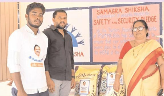
విజయవాడ పశ్చిమ, సెప్టెంబర్ 19, (ఆంధ్రపత్రిక) : స్థానిక వనటోన్ లోని సుందరమైన హై స్కూల్ పాఠశాలకు పశ్చిమ నియోజకవర్గ సజనసంబంధులు యలమంచిలి నల్లవారాయణ (సుజనా చౌదరి) ఆదేశాల మేరకు గురువారం 50 కేటేబిలి బియ్యం అందజేశారు. బాచి కల పాఠశాల అయిన సుందరమైన హైస్కూల్లో బియ్యం అందించి సాయం చేయాలని ప్రిన్సిపల్ రత్నకుమారి ఎమ్మెల్యే కార్యాయుని సంత్రుంది చారు. దీనిపై పాఠశాలకు తక్షణమే బియ్యం అంద చేయాలని సుజనా చౌదరి ఆదేశాలకు జూరి చేయగా కార్యాలయ సిబ్బంది పాఠశాలకు వెళ్లి బియ్యం అందించారు. సుందరమైన హైస్కూల్లో ఎమ్మెల్యే సుజనా చౌదరి ఆదేశాల మేరకు బియ్యం అందచేయడంపై స్థానిక జిజిసి గాంధీయాలకు మద్దని మాధవరావు హర్షం వ్యక్తం చేసారు. ఈ సందర్భంగా మాకులపై మోట్లద్దమనే ప్రజా సమస్యల పరిష్కారమే ధ్యేయంగా సుజనాచౌదరి పనిచేయగలరని కోరుకున్నారు.