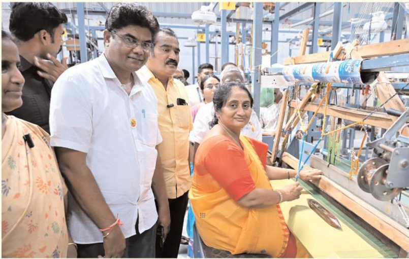
మంత్రి లోకేశ్ ఏర్పాటు చేసిన మంగళగిరి వీవర్ శాలతో వందలాది మందికి లబ్ధి-చేనేతల అభివృద్ధికి కట్టుబడిన ఉన్న సీఎం చంద్రబాబు-త్వరలో విజయవాడ తరఫు చేనేత ఎగ్జిబిషన్ ఏర్పాటు-ఎల్పిఐ ప్రభుత్వం ఏర్పాటుతో చేనేతలకు పూర్వ వైభవం మంత్రి సవిత