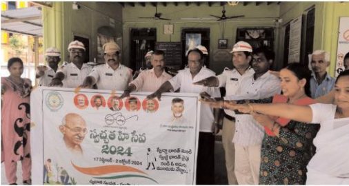
మండిపేటద్వారా, కొద్దిపాటి వర్షానికి 45వ డివిజన్ లోని ప్రధాన డ్రైనేజీ సగం లేవేందుకు బస్సాండ్, జిల్లా కోర్టు పెంఠలి, లక్ష్మీ నాగేశ్వరి నెంబరు, సిడిబి అగ్రహారం పూర్తిగా మునిగిపోతోందని, అట్లా వర్షం వచ్చినప్పుడు ముగగురుకూ డ్రైనేజీ వ్యవస్థని సరి చేసే విధంగా మంత్రి కొల్లా రవీంద్ర, ఎంపీ వల్లభేని బాలా లోని లు అధికారులతో మహబూబ్ చర్యలు తీసుకుంటున్నారని అన్నారు. మరిచివల్లుం సగరూన్ని వచ్చేందుకు, పరిశుభ్రతతో సుందర నగరంగా తీర్చిదిద్దాలి అనే ఉద్దేశంతో ఇప్పుటికే మునిసిపల్ లో అధికారులతో ప్రతి డివిజన్ లోను శానిటేషన్ డ్రైన్ నిర్మిస్తూ, తక్షణ ప్రజల ఇబ్బందులను తెలుసుకుంటూ ఆ సమస్యల పరిష్కారంతో విధంగా మంత్రి కొల్లా రవీంద్ర, ఎంపీ వల్లభేని బాలా లోని లు కృషి చేస్తున్నారు అన్నారు. ప్రజలు కూడా ఆలోచన చేసి డ్రైనేజీలో స్టాజిన్, ఇతర వ్యర్థ వదలాల్ని చేయకుండా శానిటేషన్ సిస్టం వచ్చినప్పుడు హాకిలి అందజేయాలని, పరిశుభ్రతతోనే మనం అభివృద్ధిగా ఉండగలమని ప్రజలు గ్రహించాలి అన్నారు.మరిచివల్లుం (ట్రాక్టిక్ పోలిస్ స్టేషన్ ఎనిస్ వెంకటేశ్వర్ రావు మాట్లాడుతూ కాలుష్యం నుండి మనల్ని మనం కాపాడవో వాలి అంటే ప్రతి ఒక్కరూ మొక్కులు నాటాలని, కరోజీ నాదీన మొక్కలేవు మనకు రక్షణ కనుకనా మాడుతుంది అన్నారు. మన రాష్ట్ర ప్రభుత్వం స్వచ్ఛతాని సేవ కార్యక్రమాన్ని ఎంతో ప్రతిష్టాత్మకంగా తీసుకుంది ఈ కార్యక్రమానికి ప్రజల భాగస్వామ్యం ఎంతో అవసరం అన్నారు.మొక్కులు నాటడమే కాకుండా వాటి సరిరక్షణ చూసుకోవాలని బాధ్యత మనపై ఎంతో ఉంది అన్నారు. స్వచ్ఛతాని సేవ కార్యక్రమాలలో ప్రజలందరూ భాగస్వాములే సగరూని సుందరంగా తీర్చిదిద్దుకోవాల్సిన బాధ్యత మనపై ప్రజలపై ఎంతో ఉంది అన్నారు.