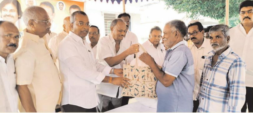
పారిశుధ్య కార్మికుల సేవలు అమూల్యమైనవి- గొల్లపూడిలో 200 మంది పారిశుధ్య కార్మికులకు దుస్తులు, నిత్యావసరాలు పంపిణీ-వైలవరం ఎమ్మెల్యే వసంత కృష్ణప్రసాదు

ప్రైవసరం, (గొల్లపూడి, సెప్టెంబర్ 19: (ఆంధ్రప్రదేశ్): అందరి సమిష్టి కృషితోనే ప్రకృతి విపత్తును సమర్థవంతంగా ఎదుర్కొన్నామని ప్రైవసరం శాసనసభ్యులు వసంత వెంకట కృష్ణప్రసాదు పేర్కొన్నారు. విజయవాడ రూరల్ పంచెంట్లోని గొల్లపూడిలో మూర్త్యాగాంధీ హెల్త్ సేర్ కమ్యూనిటీ కాంప్లెక్స్ వుపేరింగ్స్‌గర్ వారి సౌఖ్యవీటిలో 200 మంది పాఠశుద్ధు కార్యకలకులు ఆయన గురువారం దున్నట్తు, నిత్యావసర వస్తువులను పంపిణీ చేశారు.