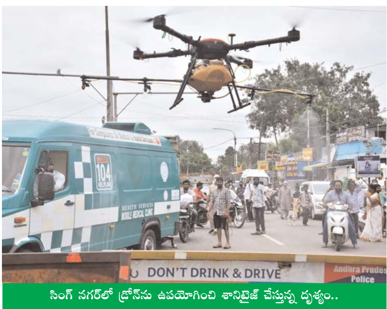
సింగ్ నగర్లో డ్రోన్‌ను ఉపయోగించి శానిటైజ్ చేస్తున్న దృశ్యం..