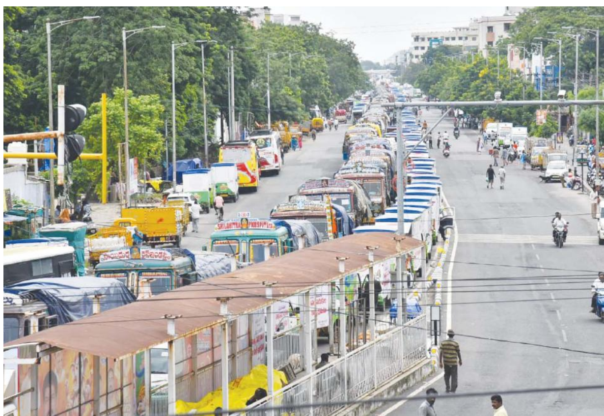
వరద బాధితుల కోసం ఆహార ధాన్యాలు పంపిణీకి వచ్చిన సివిల్ సప్లై వ్యాన్లు, లారీలు.