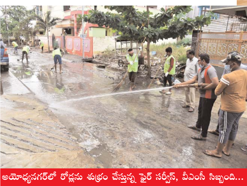
అయోధ్యనగర్లో రోడ్లను శుభ్రం చేస్తున్న ఫైర్ సర్వీస్, వీఎంసీ సిబ్బంది...