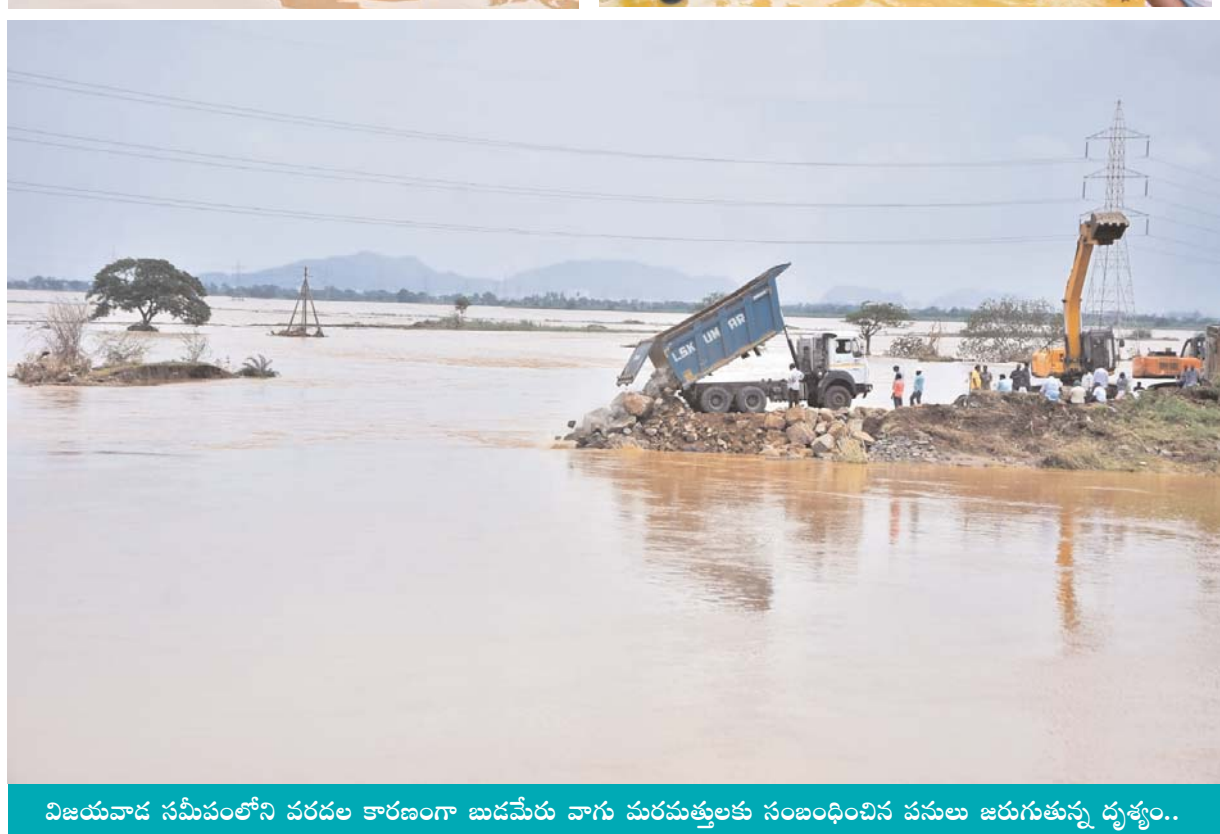
విజయవాడ సమీపంలోని వరదల కారణంగా బుడమేరు వాగు మరచుత్తులకు సంబంధించిన చనులు జరుగుతున్న దృశ్యం..