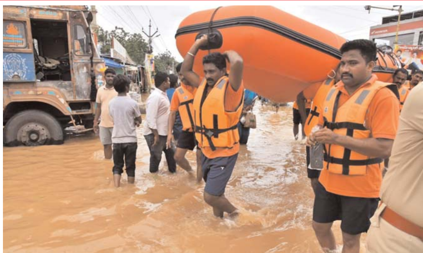
బుడమేరు వరద ప్రభావిత ప్రాంతాల్లో విధులు నిర్వహిస్తున్న ఎన్డిఆర్ఎఫ్ సిబ్బంది..