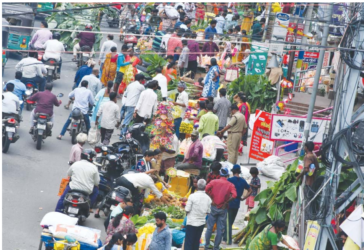
నేడు వినాయక చవితి కావటంతో పూజా సామాగ్రిని కొనుగోలు చేస్తున్న ప్రజలు..