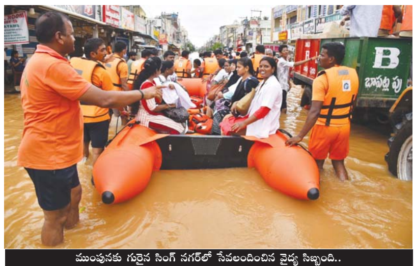
ముంపునకు గురైన సింగ్ నగర్లో సేవలందించిన వైద్య సిబ్బంది..