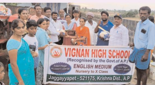
జగ్గయ్యపేట, సెప్టెంబర్ 5 (ఆంధ్రపత్రిక): జగ్గయ్యపేట లో నాలుగు రోజుల నుంచి కురుస్తున్న వర్షాలకు వరద ప్రభావానికి గురైన రెడ్డి నాయక్ తండ్రి గ్రామంలో స్థానిక విజ్ఞాన్ స్కూల్ స్టాఫ్ సందర్శించి స్కూల్ యాజమాన్యం సహకారంతో తయారు చేయబడిన నిత్యవసర సరుకులను ఒక కిలో గా తయారు చేసి వరద ముంచునకు గురైన గృహాలను సందర్శించి గృహానికి కిలో పంపిణీ చేయటం జరిగింది. బియ్యం, కందిపప్పు, పంచదార, టీ పోటీ, ఉప్పురవ్వ, సన్నపర్ల నూనె ప్యాకెట్, చింతపండు, నల్లపు లు, బజ్జీలు నల్లపులు , మసీల్ కోయి ల్స్, కొబ్బరి నూనె తదితర సరుకులతో కుడిన కిలో ఇవ్వడం జరిగింది. ఆపదలో ఆదుకున్న విజ్ఞాన్ స్కూల్ వారి యాజమాన్యం సకు మరియు స్కూల్ స్టాఫ్ గ్రామ ప్రజలు అభినందనలు తెలిపారు.