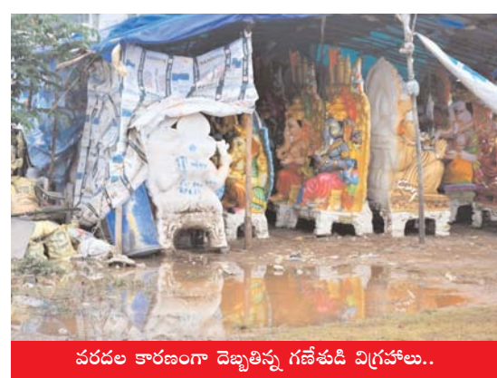
వరదల కారణంగా దెబ్బతిన్న గణేశుడి విగ్రహాలు..