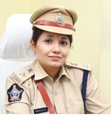
పాల్గొని, వారిపై చట్టపరమైన కఠిన చర్యలు తప్పవని జిల్లా ఎస్సీ ఎం.డిపిక ఐపిఎస్ హెచ్చరించారు.

నిర్వహించే నట్లుంటే సంబంధిత పంచాయతీ లేదా మున్సిపల్ అధికారుల నుండి అనుమతులు పొందాలని, అదే విధంగా ప్రైవేటు స్థలాల్లో నిర్వహిస్తే సంబంధిత స్థల యజమానుల నుండి ముందుగా అనుమతులు పొందాలన్నారు. ఉత్సవాలు నిర్వహించే ప్రాంతంలో వాహనాల రాకపోకలకు ఎటువంటి ట్రాఫిక్ ఇబ్బందులు తలెత్తకుండా చూడాలన్నారు. ఉత్సవాల్లో వినియోగించే మైకులు, సౌండు బాక్సులతో ప్రజలకు ఇబ్బందులు గురి చేయకూడదని, నిర్దేశించిన సమయం, నిర్దేశించిన సౌండును మాత్రమే వినియోగించాలని, అందుకు సంబంధిత అధికారుల