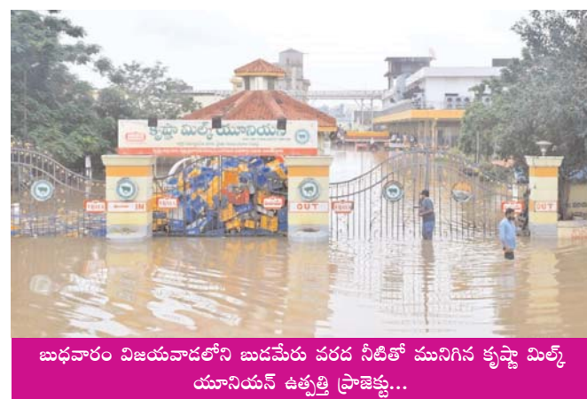
బుడమేరు విజయవాడలోని బుడమేరు వరద నీటితో మునిగిన కృష్ణా మిల్క్ యూనియన్ ఉత్పత్తి ప్రాజెక్టు...