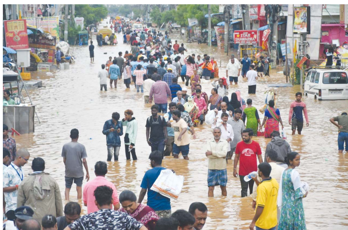
ఇంకా జలమయంలోనే ఉన్న సింగ్ నగర్..