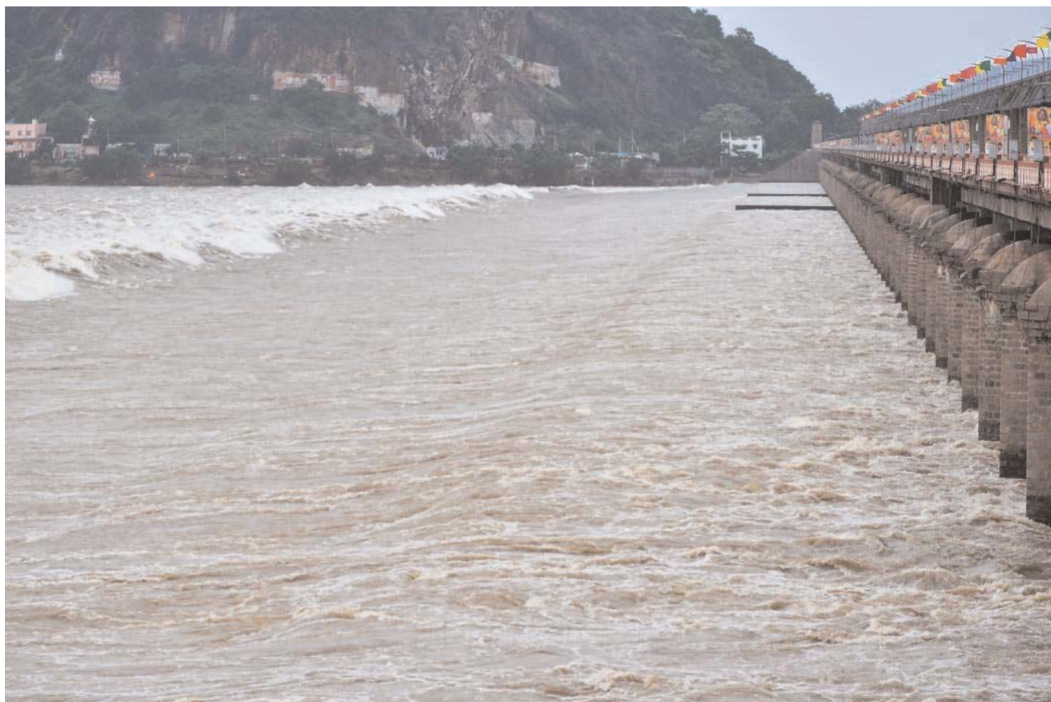
విజయవాడలోని ప్రకాశం బ్యారేజీ నుంచి తగ్గుముఖం పట్టిన వరద నీరు..