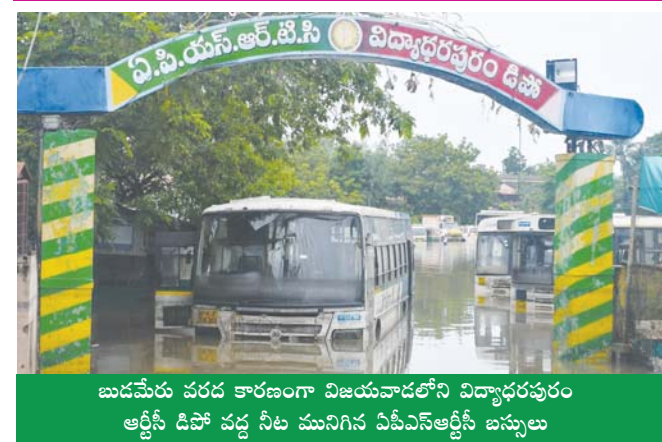
బుడమేరు వరద కారణంగా విజయవాడలోని విద్యాధరపురం ఆర్ట్స్ డిపో వద్ద నీట మునిగిన పిపిఎస్ఆర్టిసి బస్సులు