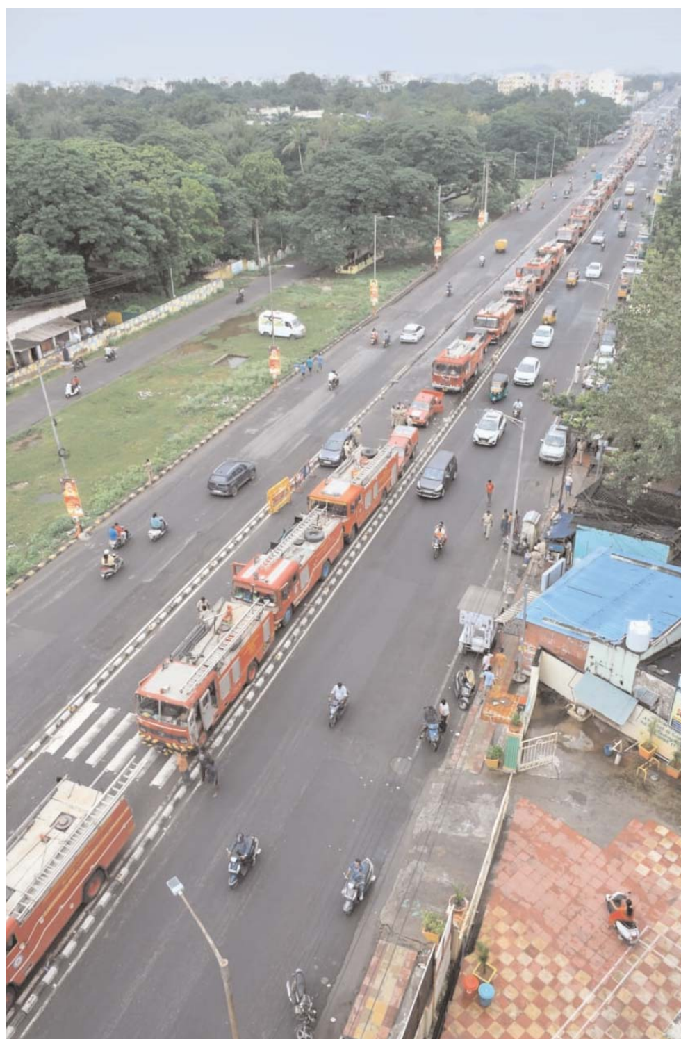
బుడమేరు వరద ప్రభావిత ప్రాంతాల్లో వనరుద్ధరణ పనుల కోసం పెద్ద సంఖ్యలో సిద్దమైన ట్రైల్ ఇంజన్లు...