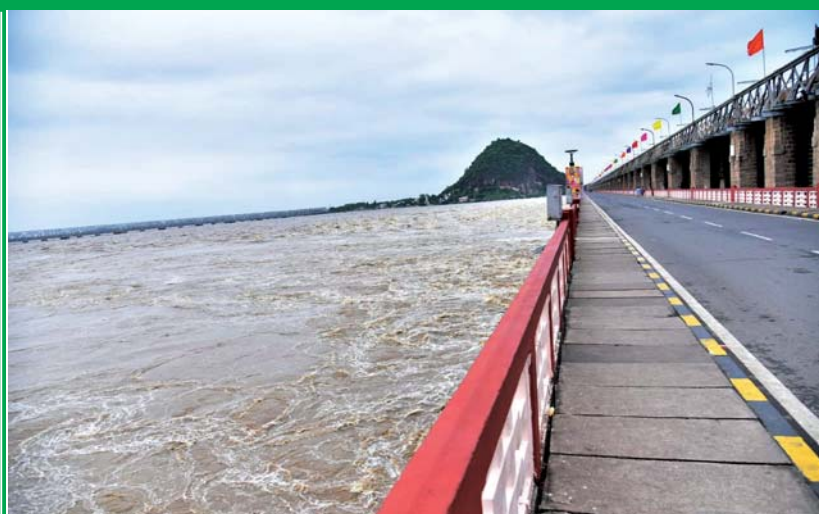
ఉధృతంగా ప్రవాహిస్తున్న కృష్ణానది.. ప్రకాశం బ్యారేజీపై రాకపోకలను నిలిపివేసిన అధికారులు