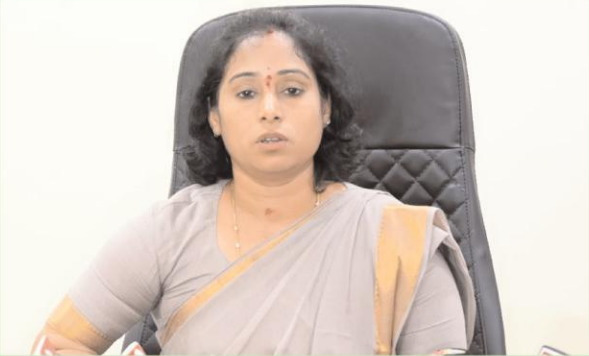
గుంటూరు, సెప్టెంబర్ 2 (ఆంధ్రపత్రిక): విజయవాడ నగరంలో వచ్చిన అకాల వరద హాఠిక చర్యలను దగ్గరండి, వేగవంతం చేస్తున్న చంద్ర

వరద సహాయక చర్యలను వేగవంతం చేస్తున్న చంద్రబాబు, లోకేష్ మీద విమర్శలూ అంటూ మండిపాటు: పశ్చిమ నియోజకవర్గ ఎమ్మెల్యే గళ్యా మాధవి