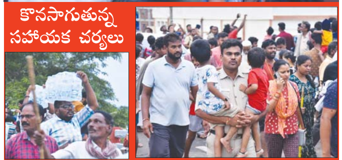
కొనసాగుతున్న సహాయక చర్యలు