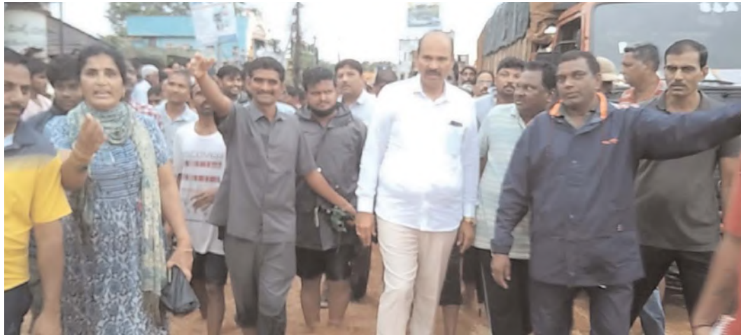
ఆస్తి నష్టాలు కలగకుండా పట్టిపట్టిన కార్యాచరణ ప్రణాళికను ముందుగానే సిద్ధం చేసుకుని అమలు చేయాలన్న ముఖ్యమంత్రి సూచనలతో మంత్రి కొలుసు పార్థసారథి నూజివీడు నియోజకవర్గంలో ముంపునకు గురయ్యే ప్రాంతాలలో విస్తృతంగా పర్యటించి అర్ధరాత్రి రెండు గంటల వరకు కూడా ప్రజలను పునరావాస కేంద్రాలకు దగ్గరుండి తరలించారు. అదే విధంగా

జిల్లాలోని ఎమ్మెల్యేలు వారి పరిధిలో ఎటువంటి నష్టం వాటిల్లకుండా అధికారులతో సమీక్షించి చర్యలు తీసుకున్నారు. జిల్లా కలెక్టర్ వెట్రీసెల్వీ జిల్లాలోని భారీ వర్షాల కారణంగా ముంపునకు గురయ్యే సమస్యాత్మక ప్రాంతాలలో పర్యటించి అక్కడి ప్రజలను పునరావాస కేంద్రాలకు తరలించే పనులను దగ్గరుండి పర్యవేక్షించారు. జిల్లా ఎస్పీ కె. ప్రతాప్ శివకిశోర్ వరద నీటితో పొంగుతున్న కాజీ వేల వద్ద ఎటువంటి ప్రమాదాలు జరగకుండా పోలీస్ సిబ్బందితో రక్షణ చర్యలు తీసుకుని నిరంతరం పర్యవేక్షించారు. నూజివీడు నియోజకవర్గంలోని పెద్ద చెరువుకు గండి పడడంతో నూజివీడు పట్టణం, నూజివీడు, అగిరిపల్లి మండలాల్లోని పలు గ్రామాలు జలమయమయ్యాయి. మంత్రి పార్థసారథి జిల్లాలో ఎన్టీఆర్ఎఫ్ బృందాలను ముందు జాగ్రత్త చర్యగా సిద్ధం చేయడంతో, ఎటువంటి ప్రాణ నష్టం జరగకుండా ముంపు ప్రాంతాలలోని ప్రజలను సురక్షిత ప్రాంతాలకు తరలించడానికి వీలు కలిగింది. చిత్తశుద్ధి, నిబద్ధతతో పనిచేస్తే ఎంతటి వైపరీత్యాలనైనా ధీమాగా ఎదుర్కోగలమని మంత్రి పార్థసారథి, జిల్లా కలెక్టర్ కె. వెట్రీసెల్వీల నేతృత్వంలో జిల్లా అధికారులు నిరూపించారు.