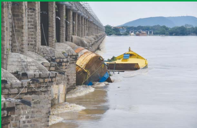
వరద ప్రవాహానికి కోట్లకు వచ్చి బ్యారేజీ గేట్లును తాకిన బోట్లు..