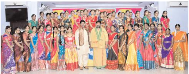
గుంటూరు : ఆగస్టు 30 (ఆంధ్రపత్రిక) : భారతదేశంలో పంచ గల రూపంలో ప్రజలలో ఆరోగ్యం, ఐక్యత, నాగరికత ఇమిడి ఉన్నాయని తద్వారా సంస్కృతి సాంప్రదాయాలు అలాగే పరిరక్షించుకున్నాయని ప్రజ్ఞ విద్యాసంస్థల కరస్పాండెంట్

ప్రజ్ఞ విద్యాసంస్థల కరస్పాండెంట్ నాయుడు చక్ర నాగ్