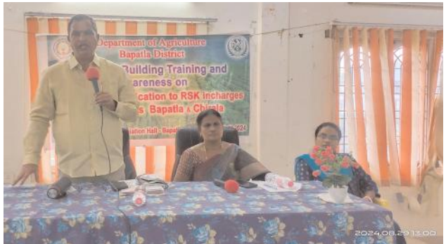
బాపట్ల ఆగస్టు 30 (ఆంధ్రపత్రిక): అత్యు సౌజన్యంతో బాపట్ల, చీరాల సబ్ డివిజన్ వ్యవసాయ సహాయకులకు మండల వ్యవసాయ అధికారులకు పంట జీవన వ్యవస్థ, చీడ పీడలు, తెగుళ్లు ఉద్యతి ఉనికి పై శిక్షణా కార్యక్రమం నిర్వహించడం జరిగింది. శిక్షణ కార్యక్రమం బాపట్ల రైస్ మిల్లర్స్ అసోసియేషన్ హాల్లో నిర్వహించడం జరిగింది. రైతులకు శిక్షణ మెరుగైన సలహా సేవలను అందించాలని లక్ష్యంతో పంట దశలు, తెగుళ్లు, వ్యాధులు గుర్తింపు పోషకాహార లోపాలతో కూడిన ప్రాథమిక వ్యవసాయం, ఉద్యాన పంటల సమగ్ర అభివృద్ధి చేయడం పై శిక్షణ అందించారు. ఆర్టిఫిషియల్ ఇంటెలిజెన్స్ మిషన్ రిర్నింగ్ టెక్నాలజీ ద్వారా లక్ష్యాన్ని సాధించడానికి డ్రాప్ రైస్ నిష్ఠం

అప్లికేషన్ అభివృద్ధి చేయబడింది. ఈ అప్లికేషన్ రాష్ట్రంలో సాగులో ఉన్న 16 ముఖ్యమైన వ్యవసాయ పంటలకు 20 రకాల పంటలు పంట జీవన వ్యవస్థ చీడ పీడలు తెగుళ్లు ఉద్యతి ఉనికి యావ్ నాలుగు చేరు చేరు తెగుళ్లుల్లో పైన పేర్కొన్న రకాల పంటలను ఫోటో లు చేయడానికి షేడ్డ్ ఫంక్షన్ గురించి వివరించారు. పంట పెరుగుదల దశలు, తెగుళ్లు వ్యాధులు, పోషకాహార లోపాలు క్రమబద్ధమైన పంటల్లోని తెగులు వ్యాధులపై నిగా ఉత్పత్తిని ప్రభావితం పంట జీవన వ్యవస్థ చీడ పీడలు తెగుళ్లు ఉద్యతి ఉనికి తెగుళ్లు వ్యాధులను గుర్తించడం డ్రాప్ చేయడం నిర్వహించడం కొనసాగి డేటా సేకరణ ద్వారా పంటలపై వాటి ప్రభావాన్ని నిర్వహించడానికి నియంత్రించడానికి తెగులు అంపా ప్రతి పట్టు దశలు తెగుళ్లు పేర్లు, వ్యాధి పేర్లు, పోషకాల పేర్లను ఎంచుకొని ఈ యావ్ ద్వారా సర్వెయర్స్ చేయబడుతుంది. అత్యు జిల్లా రిసోర్స్ సెంటర్ సిబ్బంది శిక్షణ అందించారు. ఈ కార్యక్రమానికి జిల్లా వ్యవసాయ అధికారి వై రామకృష్ణ డిప్యూటీ డైరెక్టర్ ఆఫ్ అగ్రికల్చర్ విజయనిర్మల, బాపట్ల, చీరాల సబ్ డివిజన్ సంబంధించిన గ్రామ వ్యవసాయ సహాయకులు హాజరవడం జరిగింది. ఈ శిక్షణ కార్యక్రమానికి డాట్ సెంటర్ సైంటిస్ట్ ఉపా సైంటిస్ట్ వాలర్ సైంటిస్ట్ పాల్గొన్నారు.