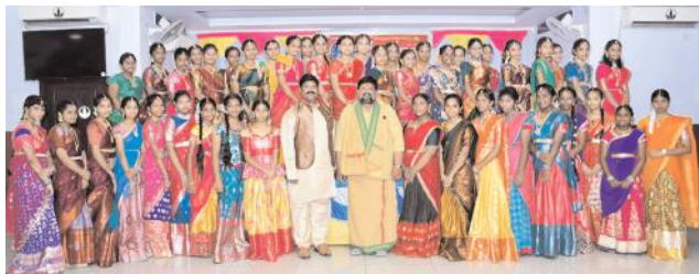
గుంటూరు : ఆగస్టు 30 (ఆంధ్రపత్రిక) : భారతదేశంలో పంచ గల రూపంలో ప్రజలలో ఆరోగ్యం, ఐక్యత, నాగరికత ఇమిడి ఉన్నాయని తద్వారా సంస్కృతి సాంప్రదాయాలు అలాగే పరిరక్షించుకున్నాయని ప్రజ్ఞా విద్యాసంస్థల కరస్పాండెంట్

ప్రజ్ఞా విద్యాసంస్థల కరస్పాండెంట్ నాయుడు చక్ర నాగ్