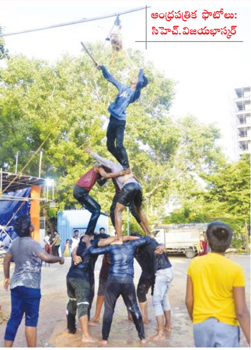
ఆంధ్రపత్రిక ఫోటోలు: సిహెచ్. విజయభాస్కర్