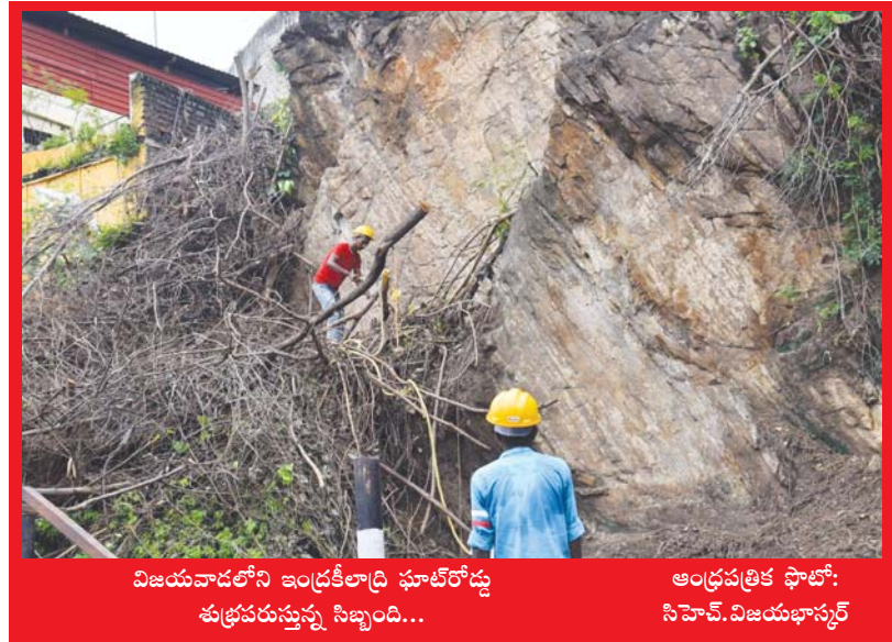
విజయవాడలోని ఇంద్రకీలాద్ ఫూట్‌రోడ్డు శుభ్రపరుస్తున్న సిబ్బంది...

అమరావతి, ఆగస్టు 23 (ఆంధ్రపత్రిక):అవినీతి లేకుండా పంచాయితీ వ్యవస్థని బలోపేతం చేసుకునే విధంగా గ్రామ సభలు జరగాలని మంత్రి నాదెండ్ల మనోహర్ పేర్కొన్నారు. గుంటూరు జిల్లా కొల్లివర మండలం వల్లభాపురంలో గ్రామ సభలో మంత్రి నాదెండ్ల మనోహర్ పాల్గొన్నారు. గ్రామ సభలో ప్రజల నుంచి వచ్చిన అర్జీలు స్వీకరించి, వాటి పరిష్కారానికి అధికారులకు ఆదేశాలు జారీ చేశారు.