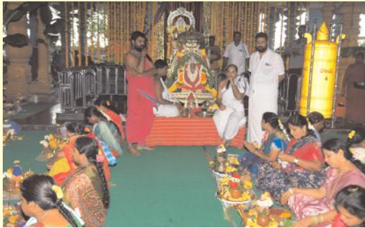
వేమవరం (గుడ్లపల్లె మండలం) ఆగస్టు 23 (ఆంధ్రపత్రిక): గుడ్లపల్లె మండలం వేమవరం గ్రామంలో వేంచేసి ఉన్న