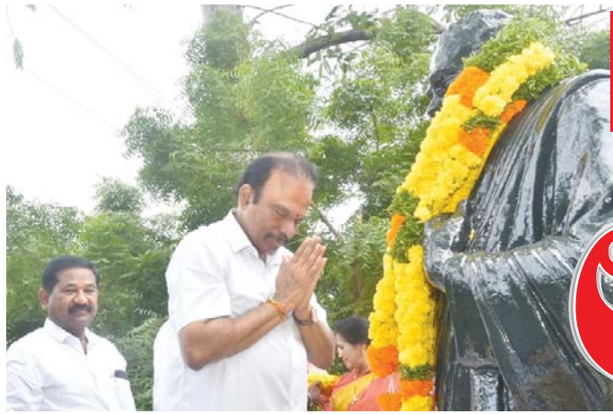
ఓంగోలు,ఆగస్టు 23 (ఆంధ్రపత్రిక): స్వాతంత్ర్య పోరాటంలోనూ, రాష్ట్రభివృద్ధిలోనూ ఆంధ్రకేసరి టంగుటూరి ప్రకాశం పంతులు పోషించిన పాత్ర అజరామరమని రాష్ట్ర సాంఘిక సంక్షేమ, దివ్యాంగులు, వయోవృద్ధుల