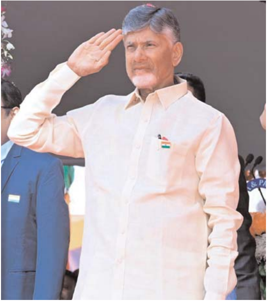
బహిరంగం చేస్తాం. తప్ప చేసిన ఏ ఒక్కరినీ పదిలిపెట్టం. నాటి ఆక్ర మాలపై లోతైన దర్యాప్తు చేయిస్తాం. అక్రమార్కులను శిక్షించి తీరు తాం అని చంద్రబాబు తెలిపారు.

తోతున్నాం. నూతన ఆలోచనలతో 15 శాతం వృద్ధిరేటు సాధించ ాడమే లక్ష్యంగా అడుగులు వేస్తున్నాం. దేవుడి దయ వల్ల సాగునీటి ప్రాజెక్టులకు జులైలోనే జలకళ వచ్చింది. కృష్ణానదిపై ఉన్న ప్రాజెకు ల్లన్నీ నిండాాయి. సమర్థ నీటి నిర్వహణ ద్వారా అన్ని ప్రాంతాలకు సాగునీరందిస్తాం. రైతు ఆదాయం పెంచి వ్యవసాయాన్ని లాభసాటిగా మారుస్తాం. వంతధార, నాగావణి, గోదావరి, కృష్ణా, పెన్నా నదుల అనుసంధానం మా ప్రభుత్వ విధానం. గత ప్రభుత్వ అసమర్థతతో దెబ్బతిన్న పోలవరాన్ని ముందుకు తీసుకెళ్లాం. యువతకు అవకాశాలు సృష్టిస్తే అదృతాలు సాధిస్తారు. అందుకే వైపుణ్య గణనకు శ్రీకారం చుట్టాం. దీంతో మెరుగైన ఉపాధి విచారణ జరిపిస్తాం. కూలమి ప్రభుత్వం ఏర్పాటు కాగానే ఉచిత ఇసుకపై నిర్ణయం తీసుకున్నాం. గ్రామ, వార్డు సచివాలయాల ద్వారా ఇసుకను ఆర్డర్ చేసుకునే వెసులుబాటు కల్పించాం. మంత పకన్నందిగా దీన్ని అమలు చేస్తాం. ప్రభుత్వ ఉద్యోగులంటే ప్రభు త్వంలో భాగస్వామ్యం. వాళ్లకు ఒకటో తేదీనే జీతాలు ఇస్తున్నాం. అభివృద్ధి, సంక్షేమం, సామాజిక న్యాయం, సూపర్ సిక్వితో 6 హామీలు ఇచ్చాం. రాష్ట్ర పరిస్థితిపై ఏడు అంశాల్లో శ్వేతపత్రాలు విడుదల చేశాం. పోలవరం, అమరావతి, రాజధాని, విద్యుత్ వంటి శాఖలపై శ్వేతపత్రాలు విడుదల చేశాం. సహజ వనరుల దోపిడీని