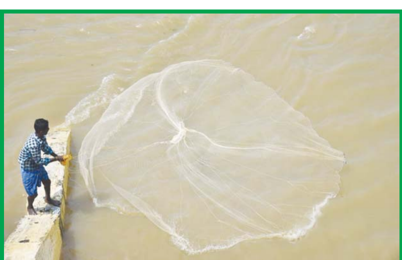
విజయవాడలోని ప్రకాశం బ్యారేజీ వరద ప్రవాహంలో చేపలకోసం వల విసురుతున్న మత్స్యకారుడు

విజయవాడ, ఆగస్టు 11(ఆంధ్రపత్రిక):ఏపీలో చంద్రబాబునాయుడు ముఖ్యమంత్రిగా పగ్గాలు చేపట్టిన తర్వాత పాలనను పరుగులు తీయస్తున్నారు. గత ప్రభుత్వంలో చోటుచేసుకున్న లోటుపాట్లను పరిశీలించి అవి తమ ప్రభుత్వంలో తలెత్తకుండా జాగ్రత్తగా అమలుచేసుకుంటూ వస్తున్నారు. కొద్దిరోజుల క్రితమే రైతులకు నూత్న సేద్య పథకాన్ని ప్రకటించిన చంద్రబాబు ప్రభుత్వం తాజాగా అన్నదాతల కోసం మరో నిర్ణయాన్ని అమలు చేయబోతోంది. ఈ-ఎంటర్ నమోదైన రైతులకు ఉచిత పంటల బీమా పథకాన్ని వర్తింపజేస్తోంది. గత ప్రభుత్వ హయాంలో రైతులకు సంబంధించి తీసుకున్న నిర్ణయాలను చంద్రబాబు ప్రభుత్వం పరుసగా సమీక్షించుకుంటూ వస్తోంది. దీనిలో భాగంగానే పంట బీమా సమోదలో అన్నదాతల వ్యయప్రయాసలను తగ్గించేందుకు ఈ-ఎంటర్ నమోదైతే చాలు అని ప్రకటించింది. వచ్చే రబీ సీజన్ నుంచి 2019లో వైసీపీ ప్రభుత్వం రాకముందు ఏ విధానమైతే ఉండో దాన్ని వర్తింపజేస్తోంది.ఈ విధానాన్ని మంత్రివర్గ ఉపసంఘం సిఫార్సు చేసింది. ఇప్పటికే రాష్ట్రంలో ఖరీఫ్ సీజన్ ప్రారంభమైందని, పంటల బీమా కోసం గత ప్రభుత్వం టెండర్ల ప్రక్రియను పూర్తిచేసిందని, ఇప్పుడు తిరిగి టెండర్లు పిలిస్తే ప్రక్రియ చాలా అలస్యమవుతుందని వ్యవసాయ శాఖ అధికారులు ముఖ్యమంత్రి దృష్టికి తీసుకువెళ్లగా ఆయన అన్నదాతలు నష్టపోకుండా చర్యలు తీసుకోవాలంటూ ఆదేశించారు. ప్రస్తుతం ఉన్న ఖరీఫ్ సీజన్కు పాత విధానమే అమలు చేసి వచ్చే రబీ సీజన్ నుంచి కొత్త విధానం అమలు చేయాలని వ్యవసాయశాఖ అధికారులు నిర్ణయించారు.