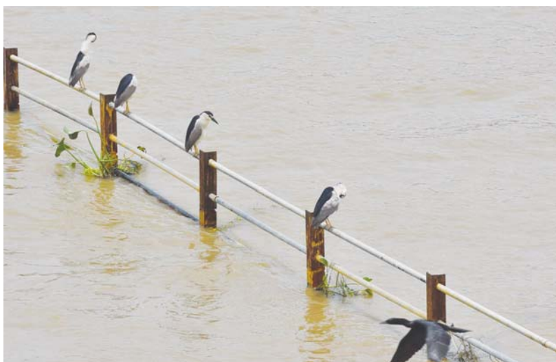
శుక్రవారం విజయవాడలోని ప్రకాశం బ్యారేజీ ప్రవాహంలో వచ్చే చేపల కోసం ఎదురుచూస్తున్న పక్షులు..

-మహిళా సాధికారత దిశగా సమాజ దృక్పథంలో మార్పు రావాలి - మహిళా సాధికారత ద్వారానే ప్రజాస్వామ్యంలో అన్ని వర్గాల సాధికారత సాధ్యమవుతుంది - మాజీ ఉపరాష్ట్రపతి ముప్పవరపు వెంకయ్య నాయుడు