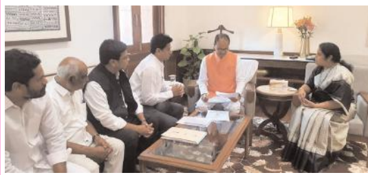
రాజమహేంద్రవరం, ఆగస్టు 9 (ఆంధ్రపత్రిక): జాతీయ మామిడి బోర్డును ఆంధ్ర ప్రదేశ్ కేంద్రంగా ఏర్పాటు చేయాలని బీజేపీ రాష్ట్ర అధ్యక్షులు, ఎంపీ దగ్గుబాటి పురందేశ్వరి డిమాండ్ చేశారు. ఢిల్లీలోని పార్లమెంట్ సందు కేంద్ర వ్యవసాయ శాఖ మంత్రి