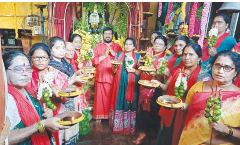
నాగమానసాదేవి మందిరంలో నాగపంచమి