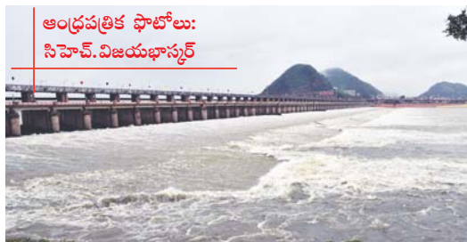
విజయవాడలోని ప్రకాశం బ్యారేజీ నుంచి వరద నీటిని విడుదల చేసిన నీటిపారుదలశాఖ అధికారులు..