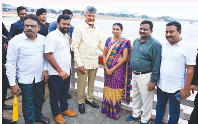
ప్రకాశం బ్యారేజీ దగ్గర సామాన్యులతో ఫోటోలు దిగి, వారితో మాట్లాడిన సీఎం