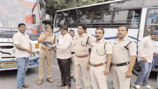
గుంటూరు : జూలై 27( ఆంధ్రపత్రిక ): గుంటూరు నగరంలో తిరుగుతున్న ప్రైవేట్ సిటీ బస్సులపై శనివారం సాయంత్రం ఆర్. డి.ఎ. అధికారులు ప్రత్యేక తనిఖీలు నిర్వహించారు. గుంటూరు నగరంలో ప్రైవేట్ సిటీ బస్సులపై రహదారి భద్రత నిబంధనలను ఉల్లంఘిస్తూ మరియు నిర్లక్ష్యంగా నడుపుతున్నారని తరచూ ఫిర్యాదులు అందుతున్న నేపథ్యంలో గుంటూరు ఆర్.డి.ఏ.