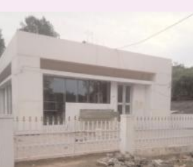
అడ్లంకి జూలై 27(ఆంధ్రపత్రిక): సూతనంగా రాష్ట్రంలో ఏర్పాటైన ఎస్సీ వి కాలనీ ప్రభుత్వం ప్రతి ప్రభుత్వంగా తీసుకున్న రాష్ట్రంలో సందమూరి తారక రామారావు పేరుతో ఉన్న అన్న క్యాంపేన్ లను పునర్