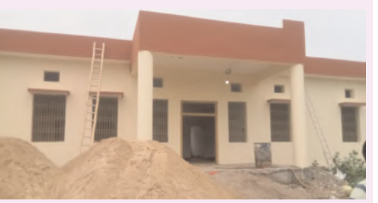
అడ్లంకి జూలై 27(ఆంధ్రపత్రిక): అడ్లంకి పట్టణం రేడింగవరం రోడ్ లోని రెండవ పట్టణ ప్రాథమిక ఆరోగ్య కేంద్రం కోటి 21 లక్ష వ్యయంతో సూతన భవనాన్ని నిర్మించడం జరుగుతుందని అడ్లంకి మున్సిపాలిటీ కమిషనర్ ఎం సత్యనారాయణ తెలిపారు ఈ సందర్భంగా ఆయన మాట్లాడుతూ ప్రస్తుతం అడ్లై భవనంలో వైద్య సిబ్బంది ప్రజలకు వైద్యం అందిస్తూ ఉన్నారు గత ప్రభుత్వంలో 70 శాతం నిర్మాణ పనులు జరిగినవి మిగిలిన పనులను శరవేగంగా నిర్మాణ పనులన్ని పూర్తిచేసి ఆరోగ్య కేంద్రాన్ని అడ్లంకి ప్రజలకు అందుబాటులోకి తీసుకొస్తామని వాతావరణం మార్పు వలన ప్రస్తుతం సీజనల వ్యాధులు ప్రజలను చాలా ఇబ్బందులు గురి చేస్తున్నావి వీటిని దృష్టిలో ఉంచుకొని ఆరోగ్య కేంద్రాన్ని వచ్చే నెలలోనే ప్రారంభించడానికి ప్రయత్నం చేస్తామన్నారు.