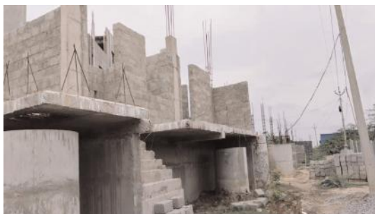
చోడంగ చూస్తున్న రెవెన్యూ అధికారులు - కట్టలకు గురౌతున్న ప్రభుత్వ భూములు- కట్టదేవకుంట గ్రామంలో భూ ఆక్రమణకు ప్రయత్నం - ప్రస్తుత మార్కెట్ విలువ కోటి పై మాజీ

మంత్రాలయం, జూలై 26 (ఆంధ్రపత్రిక): నియోజకవర్గ కేంద్రమైన మంత్రాలయం మండలంలోని ప్రభుత్వ ఆస్తులపై భూ కబ్జాదారుల కన్నెశారు. ఇటీవల కాలంలో ఇలాంటి కబ్జాలు ఎక్కువయ్యాయి.