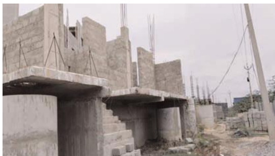
చోడంగ చూస్తున్న రెవెన్యూ అధికారులు - కట్టలకు గురౌతున్న ప్రభుత్వ భూములు- కట్టడేవకుంట గ్రామంలో భూ ఆక్రమణకు ప్రయత్నం - ప్రస్తుత మార్కెట్ విలువ కోటి పై మూడే

మంత్రాలయం, జూలై 26 (ఆంధ్రపత్రిక): నియోజకవర్గ కేంద్రమైన మంత్రాలయం మండలంలోని ప్రభుత్వ ఆస్తులపై భూ కబ్జాదారుల కన్నెశారు. ఇటీవల కాలంలో ఇలాంటి కబ్జాలు ఎక్కువయ్యాయి.