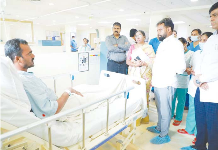
మృతుడి కుటుంబానికి రూ.50 లక్షల పరిహారం

జగ్గయ్యపేట, జూలై 8, (ఆంధ్రపత్రిక) : ఎన్టీఆర్ జిల్లా జగ్గయ్యపేట మండలం బూదవూడ గ్రామంలో ఉన్న ఆల్టాటెక్ సిమెంట్ కర్మాగారంలో బాయిలర్ పేలిన ఘటన బాధితులను రాష్ట్ర కార్మిక, కర్షాగార, బాయిలర్స్ అండ్ డ్రైవ్ బీమా సేవల శాఖ మంత్రివర్తులు వాసంతెట్టి సుభాష్ పరామర్శించారు. సోమవారం విజయవాడలోని మణిపాల్ (8 మంది), ఆంధ్రా ఆన్సత్తర్ల (8 మంది) చికిత్స పొందుతున్న క్షతగాత్రులను పరామర్శించి వారి కుటుంబ సభ్యులకు డ్రైవ్ చెప్పారు. ఈ సందర్భంగా ఆయన మాట్లాడుతూ.. సిమెంట్ ఫ్యాక్టరీలో బాయిలర్ పేలిన ఘటన చాలా దురదృష్టకరమన్నారు. మొత్తం 16 మంది గాయపడ్డారని, వీరిలో మణిపాల్ ఆస్పత్రిలో చికిత్స పొందుతూ ఒకరు మరణించారని తెలిపారు.