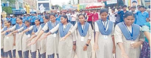
కోరుకొండ మండలం పశ్చిమగోసగూడెం నుండి కోరుకొండ వరకు ర్యాలీ నిర్వహించి బస్టాండ్ సెంటర్లో మనవహారం ఏర్పాటు చేసి ప్రతిజ్ఞ చేశారు. ఈనందర్భంగా ఎస్ఈబి సర్టిల్ ఇన్స్ట్రక్టర్

అంతర్జాతీయ మూతకద్రవ్యాల వ్యతిరేక దినోత్సవం కోరుకొండలో విద్యార్థులు ర్యాలీ, మానవహారం