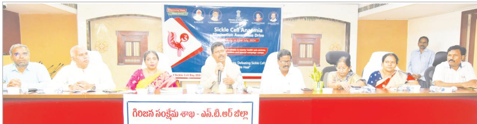
గిరిజన సంక్షేమ శాఖ - ఎన్.టి.ఆర్ జిల్లా