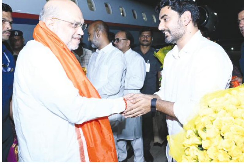
చంద్రబాబు ప్రమాణానికి విచ్చేసిన జేపి నడ్డా, అమిత్ షాలకు స్వాగతం పలికిన నారా లోకేష్