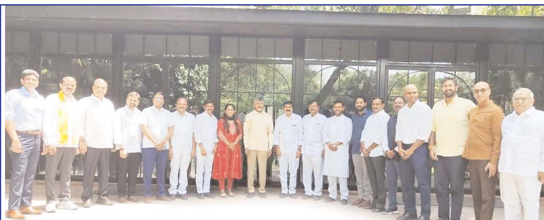
ఢిల్లీలో జరిగిన ఎన్డీఎ మీటింగ్ సందర్భంగా తెలుగుదేశం పార్టీ జాతీయ అధ్యక్షులు మరియు ఆంధ్రప్రదేశ్ ముఖ్యమంత్రి నారా చంద్రబాబు నాయుడుతో సమావేశమైన ఒంగోలు పార్లమెంటు సభ్యులు మాగుంట శ్రీనివాసులు రెడ్డి మరియు ఇతర పార్లమెంట్ సభ్యులు