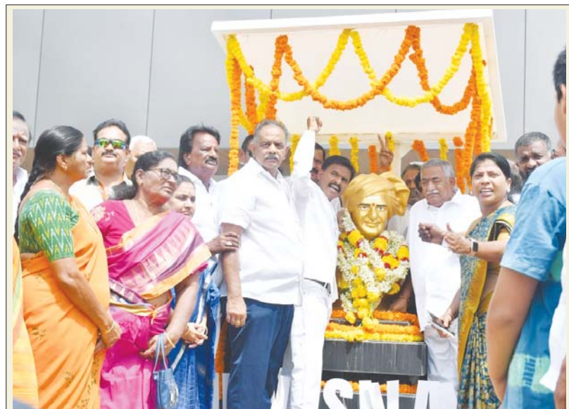
ఎన్ఆర్ఎం 101వ జయంతి సందర్భంగా కేక్ కట్ చేసి సందర్భాలు చేసుకున్న డీపీ నేతలు

కున్న హీరోల్లో ఒకరు మలయాళం నటుడు ఫహద్ ఫాసిల్. ఇటీవలే ఆహారం సామాన్యంగా బాక్సాఫీన్ ను పేక్ చేశారు. కొత్తమంగళంలోని బీస్ వ్యాధి పాఠశాల ప్రారంభోత్సవానికి ఫహద్ ఫాసిల్ ముఖ్యఅతిథిగా హాజరయ్యారు. ప్రత్యేక అవసరాలు గల పిల్లలకు వునారా వాసం కల్పించేందుకు తన సహకారం అందించారు. ఈ సందర్భంగా తన మెంటల్ హెల్త్ గురించి ఫహద్ ఫాసిల్ చేసిన కామెంట్స్ ఇప్పుడు నెట్టింట్ల వైరల్ అవుతున్నాయి. తనకు 41 ఏండ్ల వయసులో ఏడీహెచ్ఎస్ఐ అటెన్షన్ డెస్పిసిటీ హైపర్యాక్టివిటీ డిజాల్డర్ ఉన్నట్లు నిర్ధారణ అయిందని చెప్పారు. ఇది మెదడు పనితీరుపై తీవ్ర ప్రభావాన్ని చూపుతోంది. ఈ సమస్య కారణంగా ఎక్కువగా శ్రద్ధ పెట్టలేకపోవడం, కొన్ని సందర్భాల్లో అతిగా ప్రవర్తించడం, తొందరగా ఆవేశ పడటం లాంటివి తనలో గమనించానని చెప్పారు.