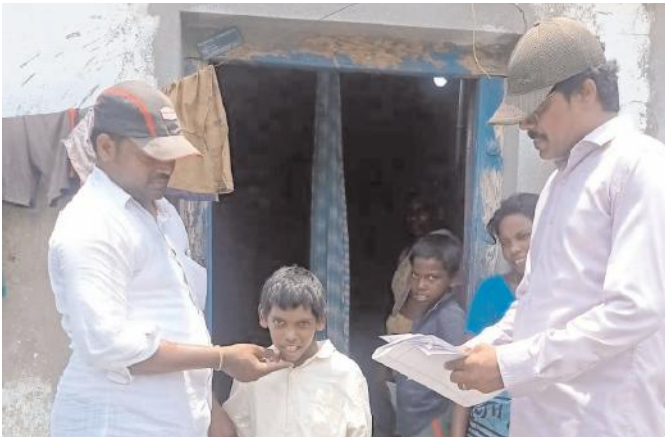
గుంటూరు : మే 28 (ఆంధ్రప్రదేశ్) : ప్రత్యేక అవసరాలు గల పిల్లలు బడిలో ఉండాలని ఉద్దేశంతో వారిని బడి బాట పట్టించే దిశగా సమగ్రశిక్ష గుంటూరు జిల్లా ప్రాజెక్టు సహిత విద్యా విభాగము సర్వే చేపట్టడం జరిగింది. సరైన అవగాహన లేని ఇంటికి పరిమితమై చదువులకు దూరంగా ఉన్ పిల్లలను గుర్తించుటకు సర్వే నిర్వహించడం జరుగుతుంది. జిల్లాలోని 18 మండలాల సహిత విద్యా విభాగం సిబ్బంది ఐకాంతిపిలు గ్రామ సచివాలయాల్లో ఎడ్యుకేషనల్ వెర్బల్ అనిస్టెంట్స్ , అర్బన్ ప్రాంతాల్లో ఎడ్యుకేషన్ సెక్టరీలు మరియు అంగన్వాడీ ల సహకారంతో గుర్తించి అందించే వైశ్ల ప్రత్యేక అవసరాల పిల్లలకు సంబంధించి గుర్తింపు చేయడం జరుగుతుంది. ఈనెల ఒకటవ తేదీన ప్రారంభమైన ప్రత్యేక అవసరాల పిల్లల గుర్తింపు సర్వే

వేగంగా కొనసాగుతుంది ఇది వచ్చే నెల 9 వరకు సాగుతుంది. ఇప్పటివరకు బడికి మధ్యలో రూరమైన వారి వివరాలు తోపాటు కానీ సూతనంగా సమాధు అవకాశం ఉన్న 700 పిల్లల గుర్తింపడం జరిగింది. వీరి తల్లిదండ్రులకు విద్య వల్ల ప్రయోజనము గురించి వివరిస్తూ అవగాహన కల్పించడం జరుగుతుంది. ప్రభుత్వం భవిత కేంద్రాల ద్వారా అందిస్తున్న సేవలు గురించి వారికి తెలియజేయడం జరిగింది. ప్రత్యేక అవసరా లు గల పిల్లలను బడిలో చేర్చించడం వల్ల వారికి వివిధ రకాల అలవెన్సులు, ఉచిత ఉపకరణాలు పొందే అవకాశం ఉంది కాబట్టి తల్లిదండ్రులు పిల్లలు ఉన్నారని బాధపడ