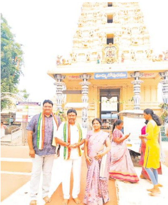
ప్రజలు మరోసారి జగన్మోహన్ రెడ్డి ముఖ్యమంత్రి కావాలని కోరుతూ తీర్పునిచ్చారు.